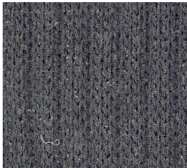
Rysunek 3 - Ściągacz kolor czarny