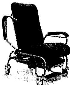
(Zdjęcie poglądowe oferowanego wózka)

Pytanie 23: Czy (w pkt. 7) Zamawiający dopuści wózek posiadający siedzisko i oparcie miękkie, zmywalne, bez właściwości antybakteryjnych?