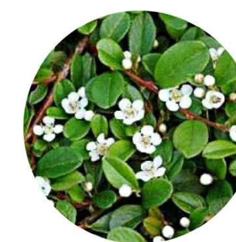
Irga Dammera odm. Mooncreeper