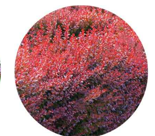
Berberys Thunberga odm. Atropurpurea