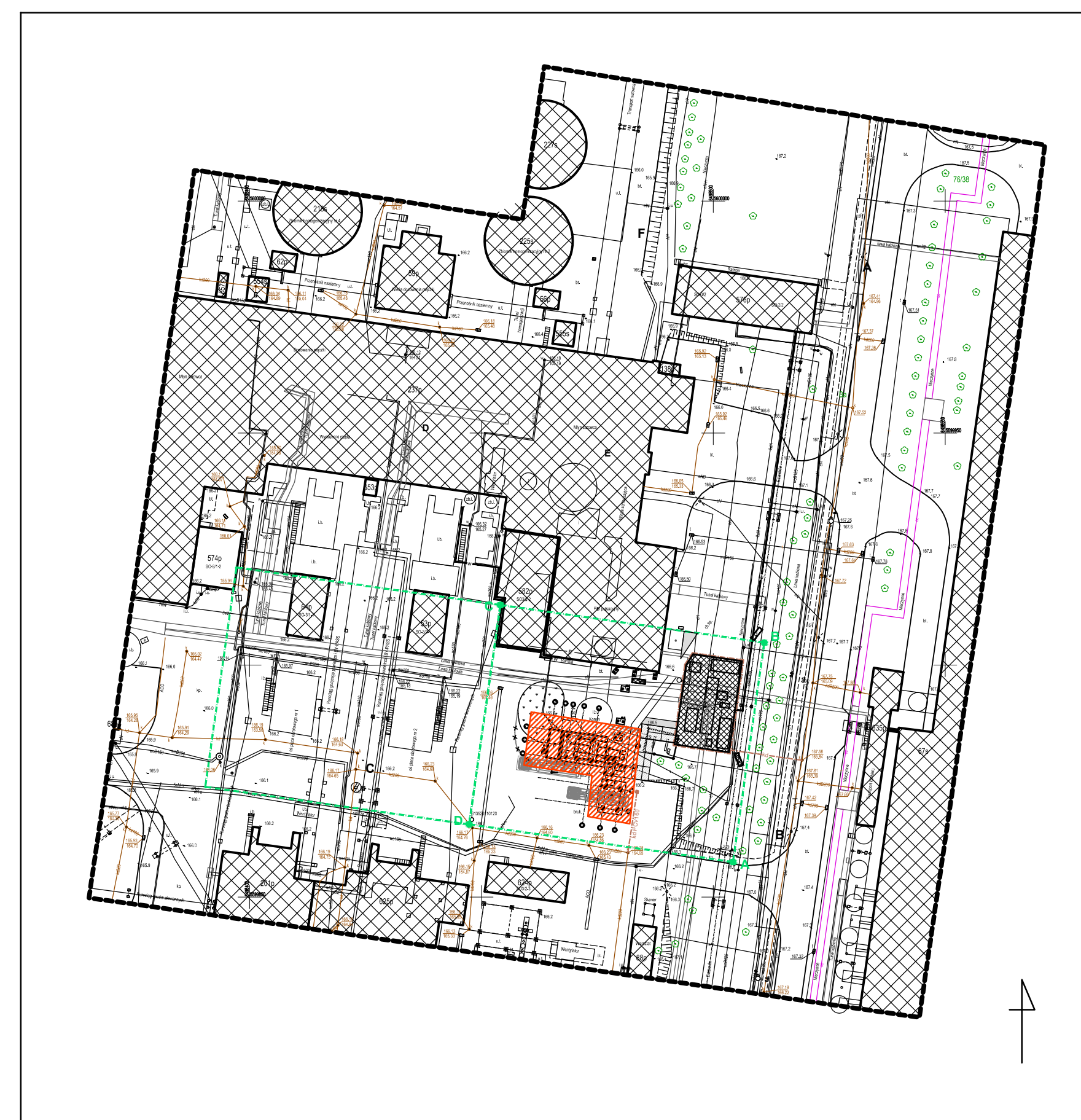
Plan orientacyjny 1:1000