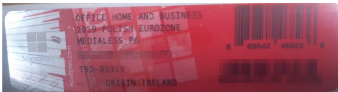
Rys. 2 przykładowy kod zabezpieczony przez producenta systemu Microsoft Windows Office Home&Business z wymazanym, znajdującym się w prawym dolnym rogu numerem seryjnym produktu. Kod licencyjny znajduje się w środku szczelnie zapakowanego i zafoliowanego pudełka (Rys. 3)