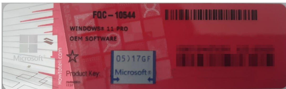
Rys. 1 przykładowy kod zabezpieczony przez producenta systemu Microsoft Windows 11 (takie same naklejki mają Windows 10) z wymazanym, znajdującym się przed i za szarą naklejką kodem licencyjnym

Poniższe zdjęcie obrazuje obecnie stosowane zabezpieczenia producenta firmy Microsoft (klucz systemu jest zabezpieczony naklejką hologramową przez producenta. Po jej zdrapaniu uzyskujemy dostęp do oryginalnego klucza):