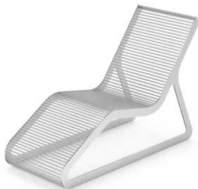
Leżanka- zdjęcie poglądowe