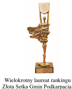
Wielokrotny laureat rankingu Złota Setka Gmin Podkarpacia