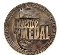
Wyróżnienie w kat. „Inwestor na Medal” w konkursie „Budowniczy Polskiego Sportu”