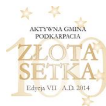
Skuteczny beneficjent środków unijnych