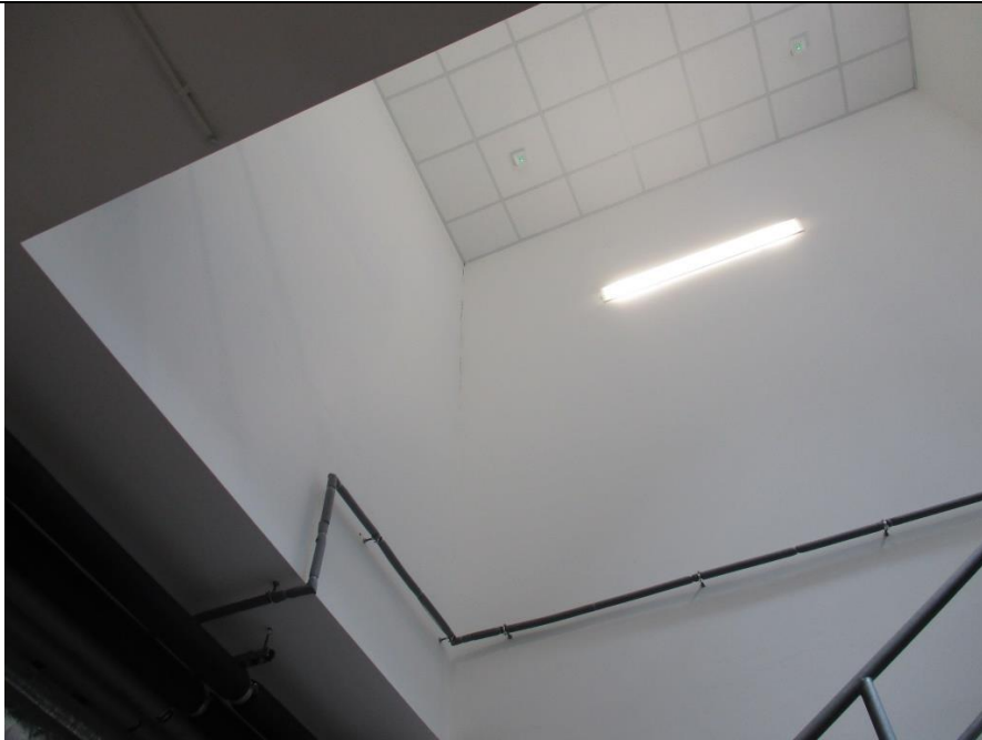
Wysokość do sufitu: 869 cm