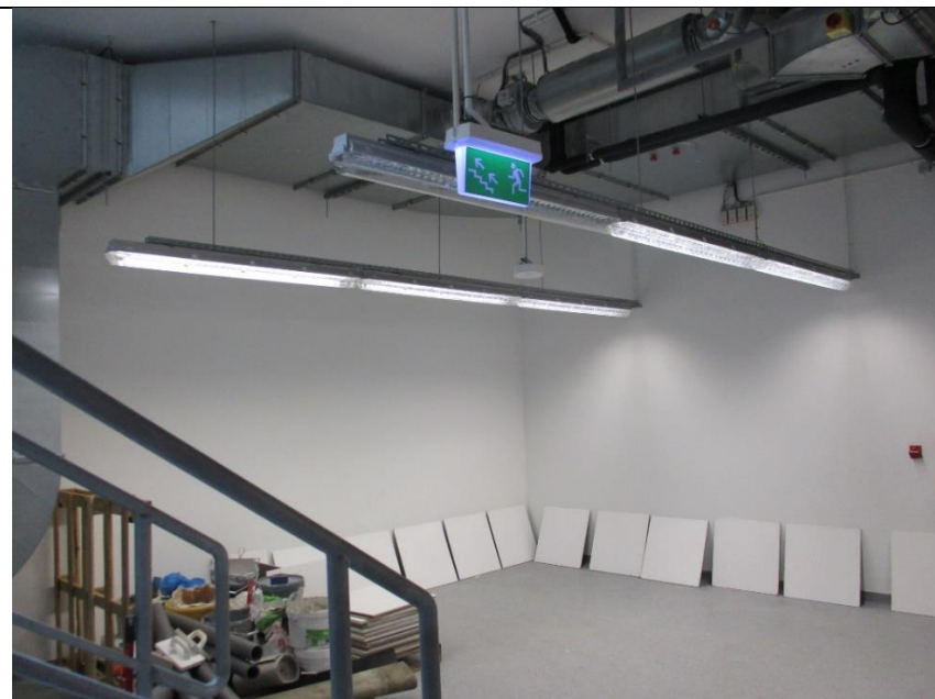
Wysokość do wentylacji 349