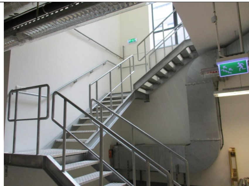
Wysokość do sufitu: 869 cm