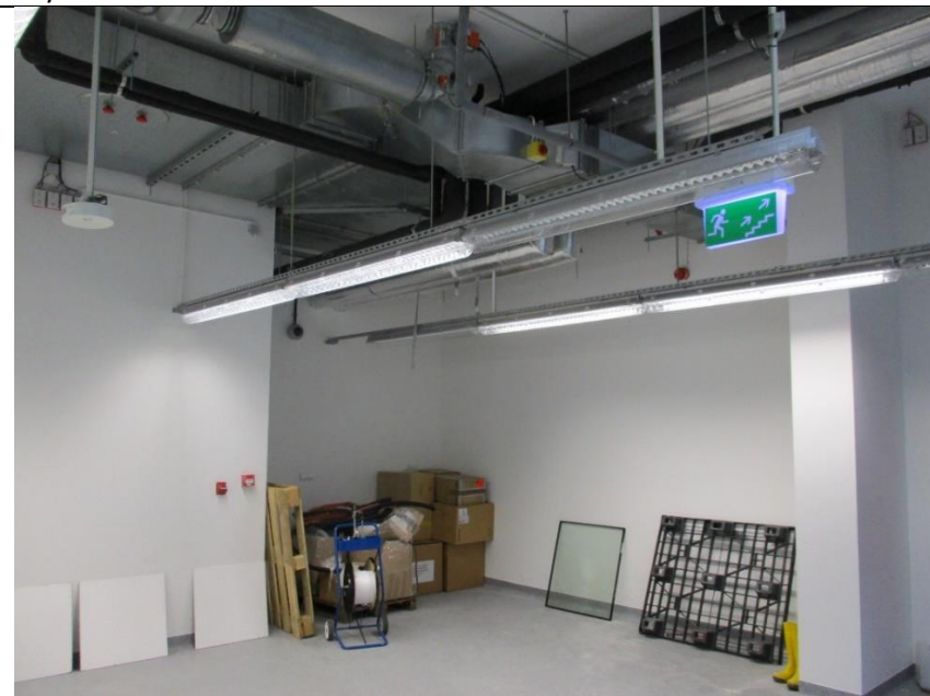
Wysokość w najniższym punkcie: 292 mm (bez lamp)