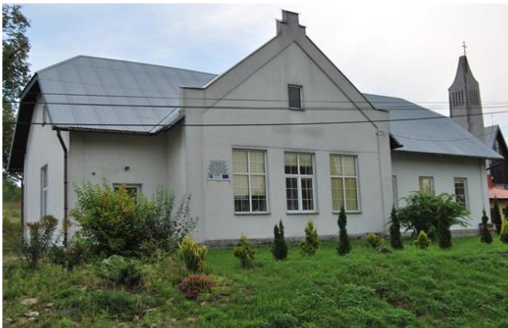
Budynek Starej Szkoły - nieużytkowany