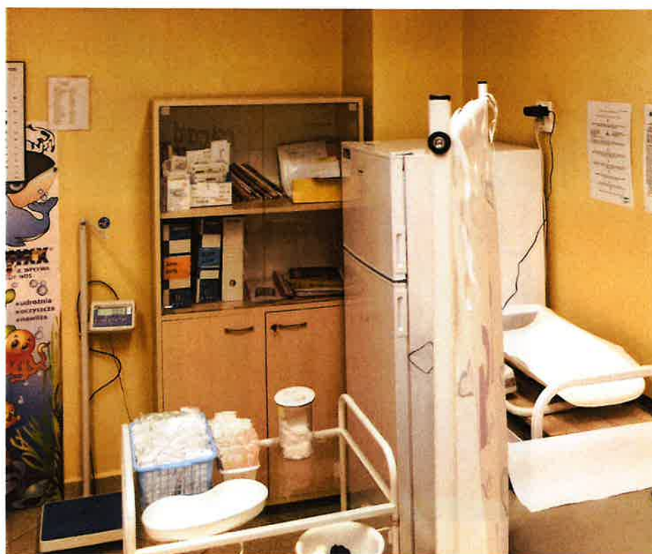
Fot.6. Gabinet zabiegowy 0.1