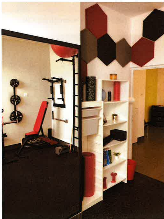
Fot.8. Studio treningowe 0.21