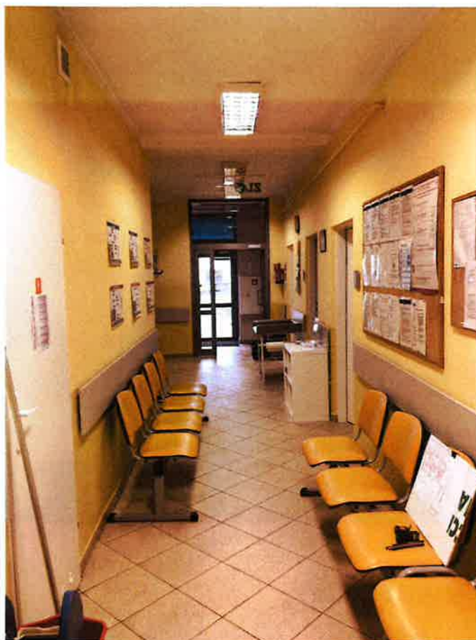
Fot.5. Korytarz wewnętrzny K.02