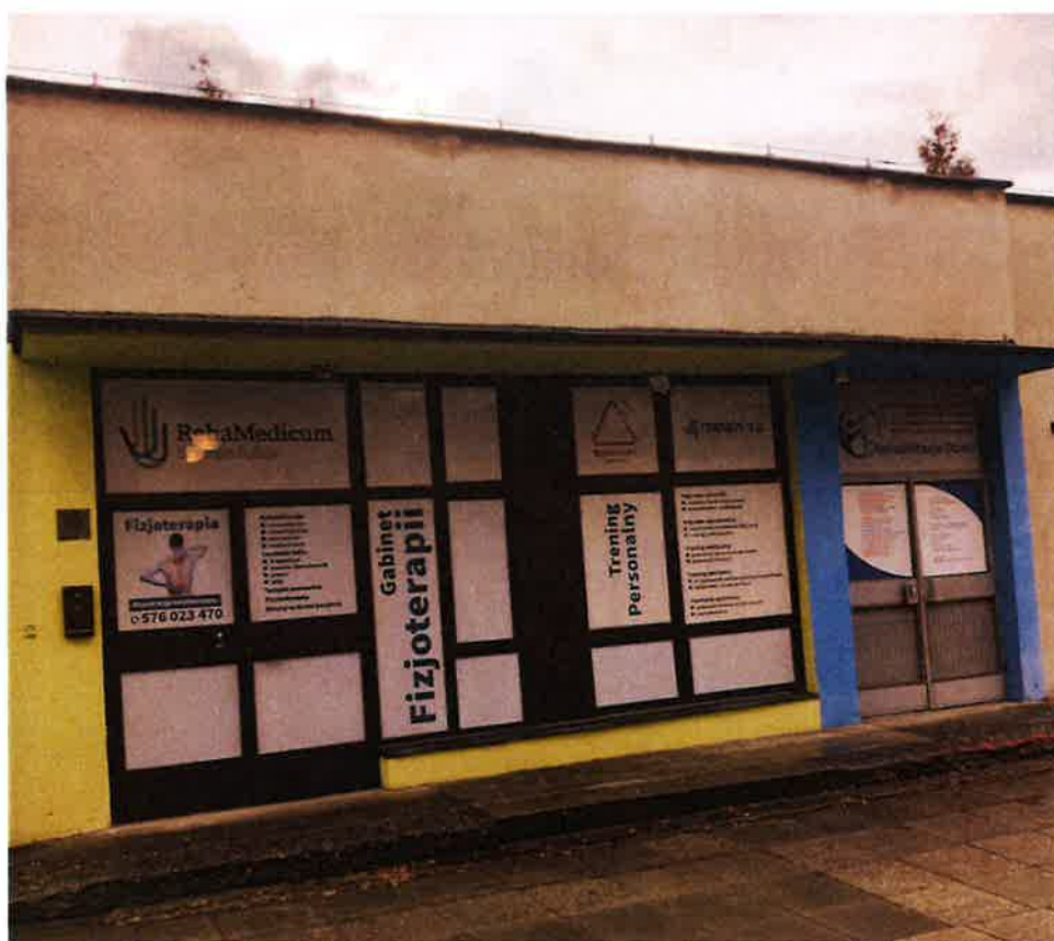
Fot.2.Elewacja północna- widoczne dwa wejścia do lokali pod wynajem