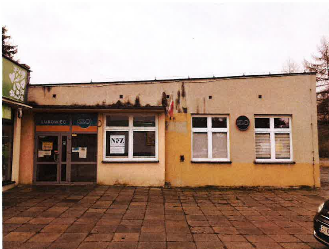
Fot.1.Elewacja wschodnia- widoczne wejście do przychodni