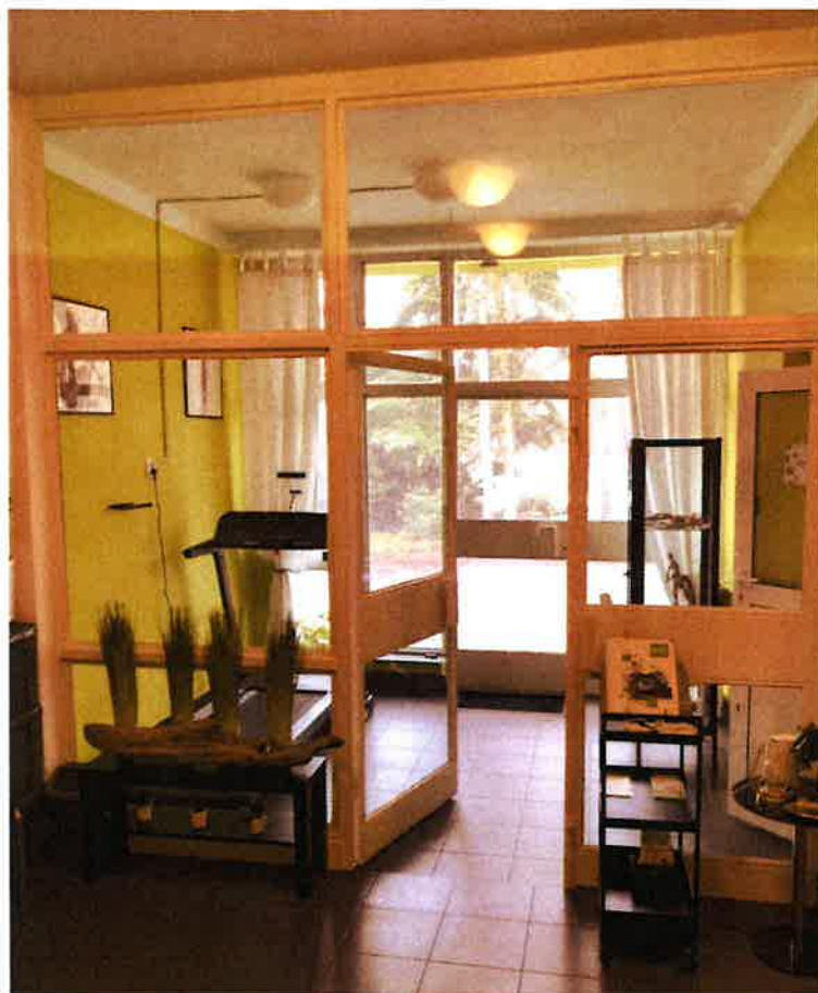
Fot.9. Korytarz wewnętrzny K.07