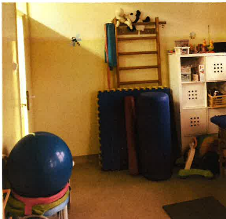
Fot.7. Sala rehabilitacji 0.12