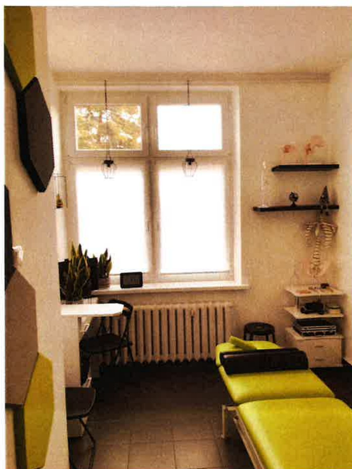
Fot.10. Gabinet fizjoterapii 0.22