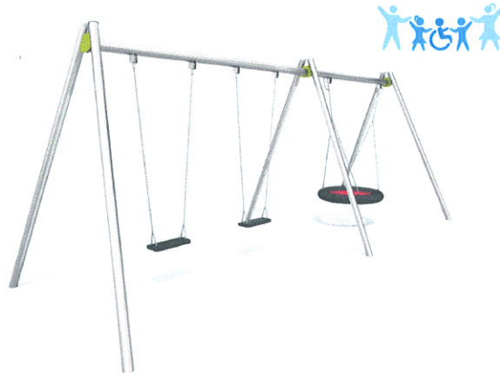
Wygląd przykładowej huśtawki.

Huśtawka jest urządzeniem integracyjnym. Wymiary strefy bezpiecznej to minimum 7,5 x 5,5 m