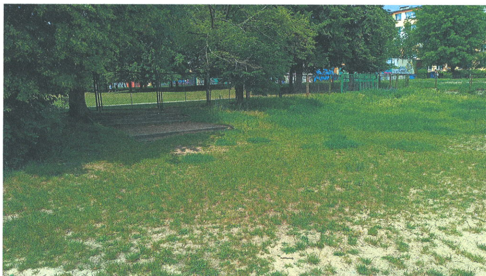
Schody do rozbiórki

Zaprojektowano dostawę i montaż dużego wielowieżowego zestawu zabawowego ze stali nierdzewnej, oraz potrójnej huśtawki wahadłowej ze stali nierdzewnej z siedziskiem gniazdo. Ponadto zostaną zamontowane dwie ławki parkowe z siedziskami i oparciami wykonanymi z tworzywa, dwa kosze na śmieci z daszkami, pięciostanowiskowy stojak rowerowy oraz tablica z regulaminem placu zabaw. Nawierzchnia bezpieczna zostanie wykonana z piasku płukanego 0,2-2,0 mm. Grubość warstwy piasku 30 cm. Pole piaskowe projektowane jest na planie prostokąta o wymiarach 15,00 x 18,00 m. Plac zabaw będzie usytuowany w linii północ – południe, czyli dłuższym bokiem wzdłuż linii drzew. Projektowana nawierzchnia będzie otoczona betonowymi obrzeżami trawnikowymi o grubości 6 cm.