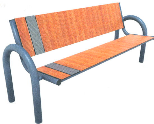
Wygląd przykładowej ławki.