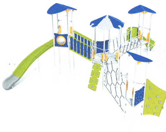
Wygląd przykładowego zestawu

Wymiary strefy bezpiecznej to minimum 11,00 x 14,00 m