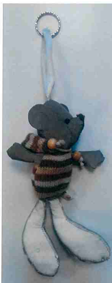
rys. wykonanie własne