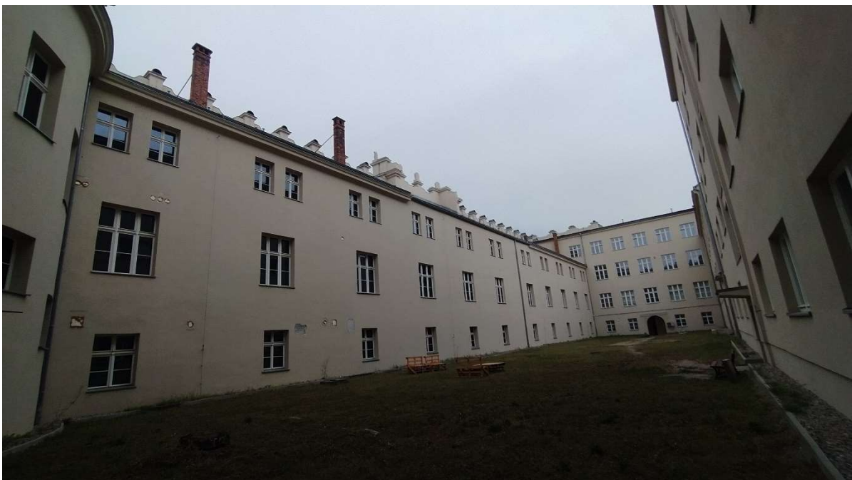
Fot. nr 1: Działziniec nr 1 – widok na Elewacje „F” i „C”