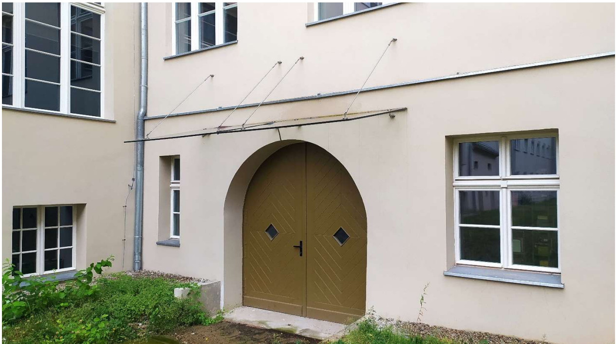
Fot. nr 9: Dziedziniec nr 2 - Elewacja „C” – zadaszenie do demontażu na czas robót