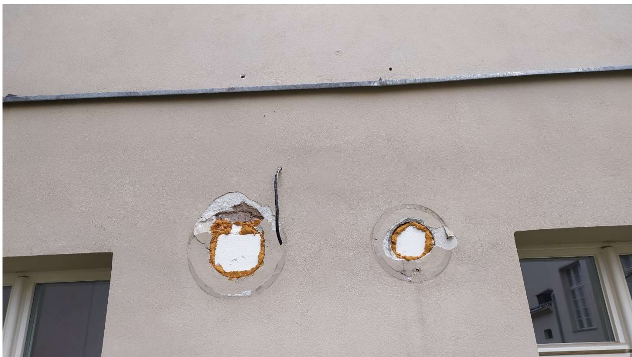
Fot. nr 6: Działanie nr 1 – Elewacja „C” widok na przepusty do zamurowania