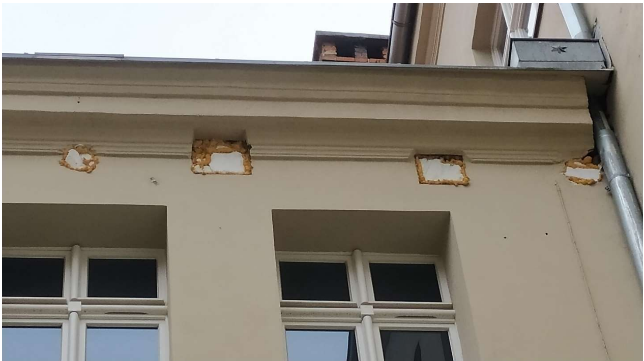
Fot. nr 5: Działanie nr 1 – widok na Elewację „F”, gzyms do odtworzenia po zamowaniu przepustów