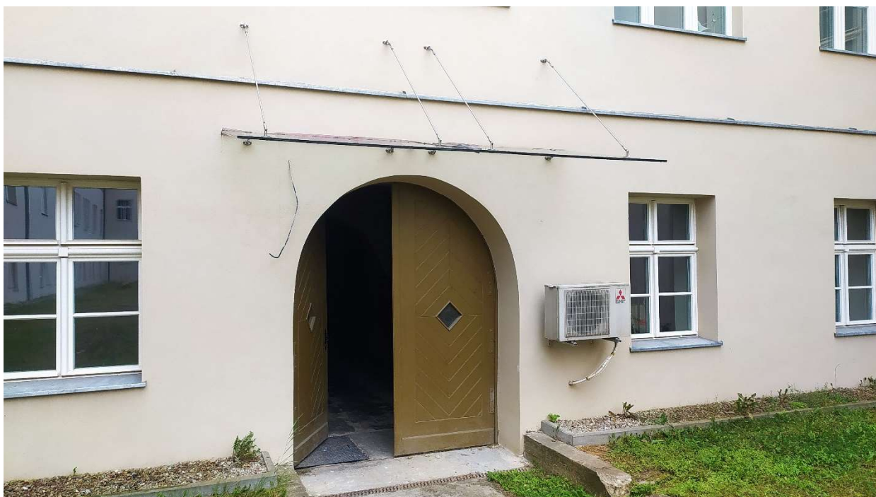
Fot. nr 3: Działanie nr 1 - Elewacja „C” – zadanie do demontażu na czas robót