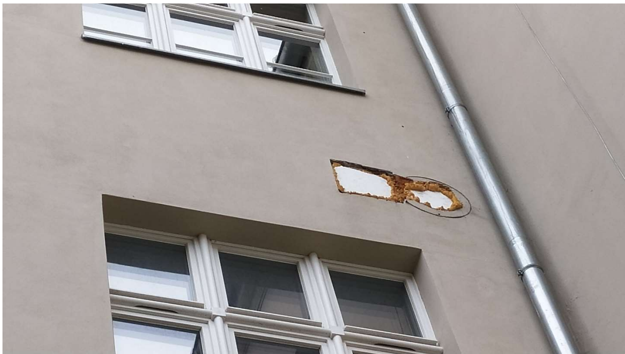
Fot. nr 10: Działanie nr 2 – Elewacja „C” widok na przepusty do zamknięcia