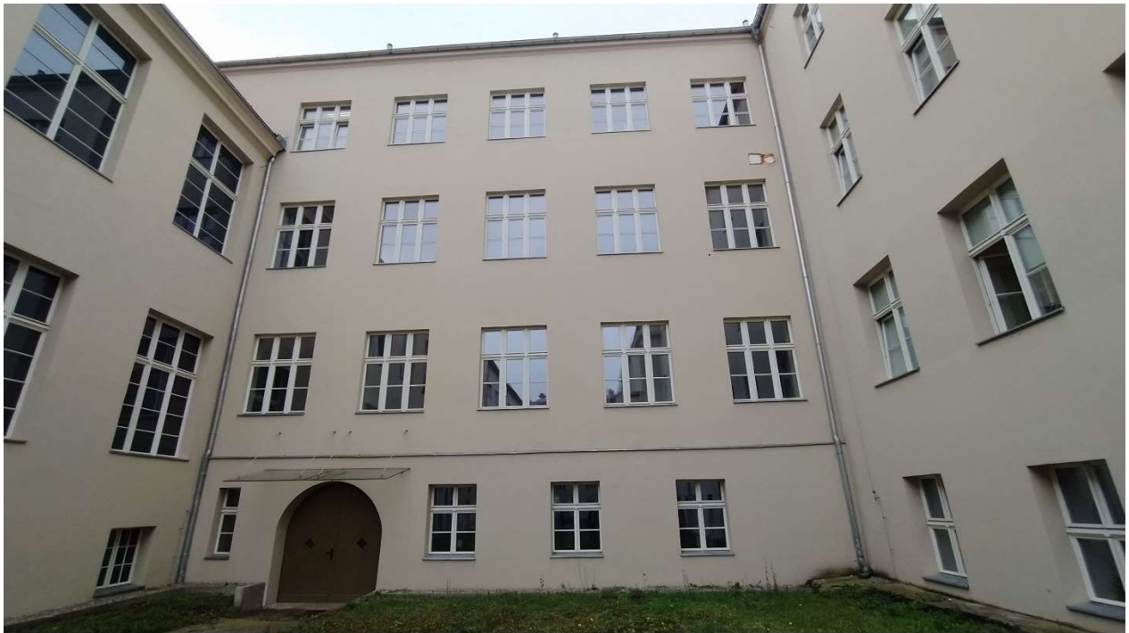
Fot. nr 8: Dziedziniec nr 2 – widok na Elewację „C”