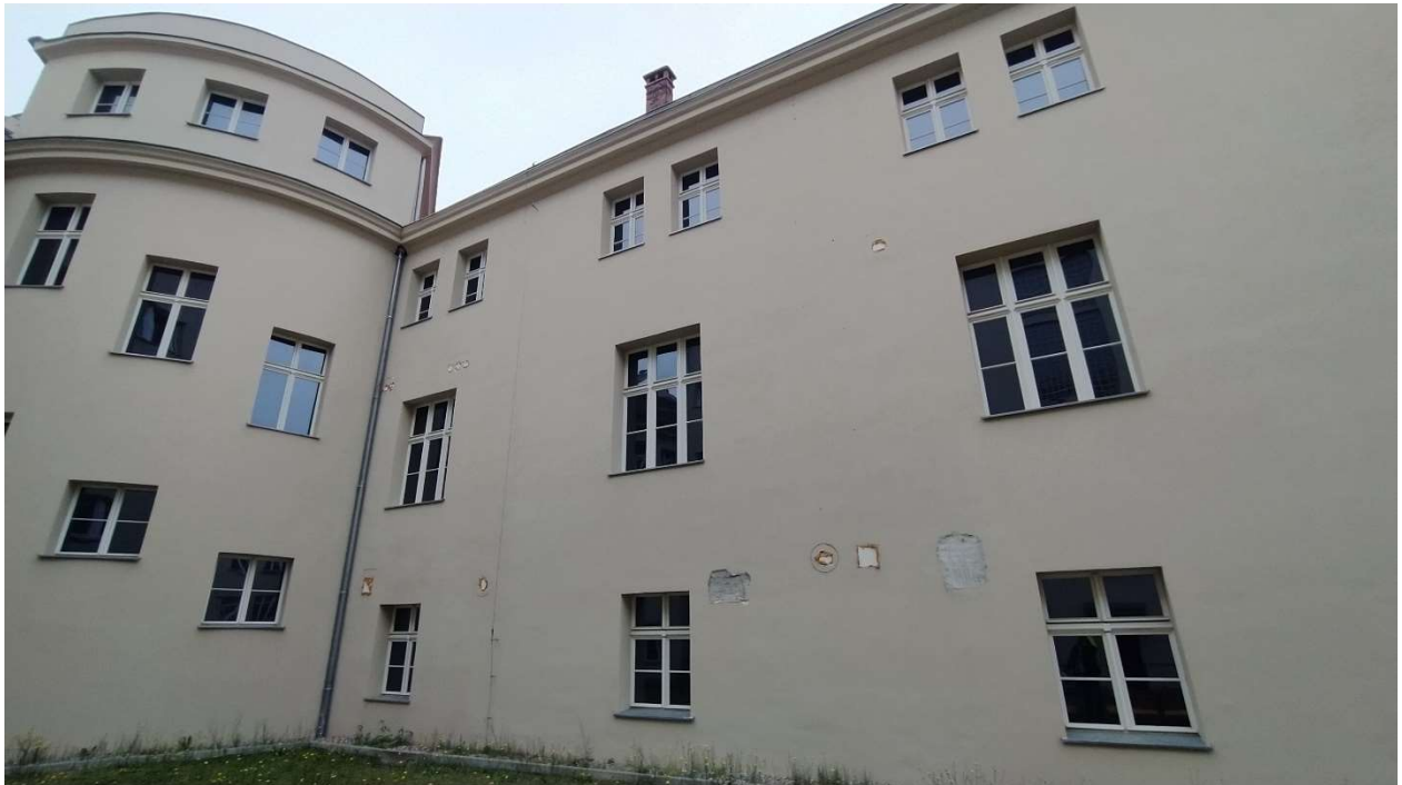
Fot. nr 4: Działanie nr 1 – widok na Elewację „F”, pozostałości po przepustach kanałów wentylacyjnych