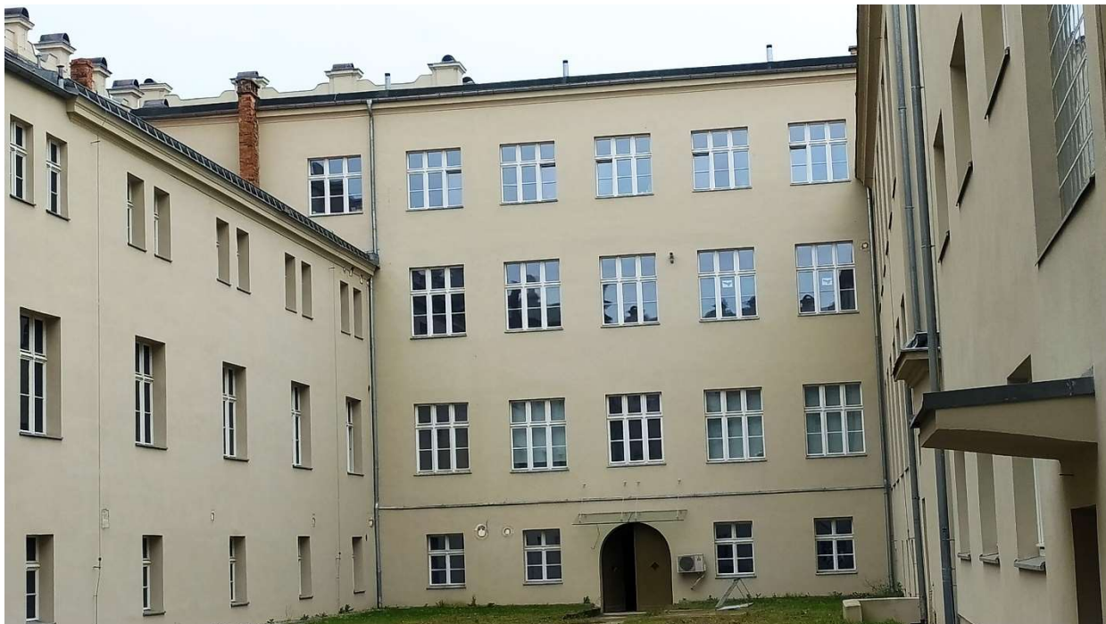
Fot. nr 2: Działanie nr 1 – widok na Elewację „C”