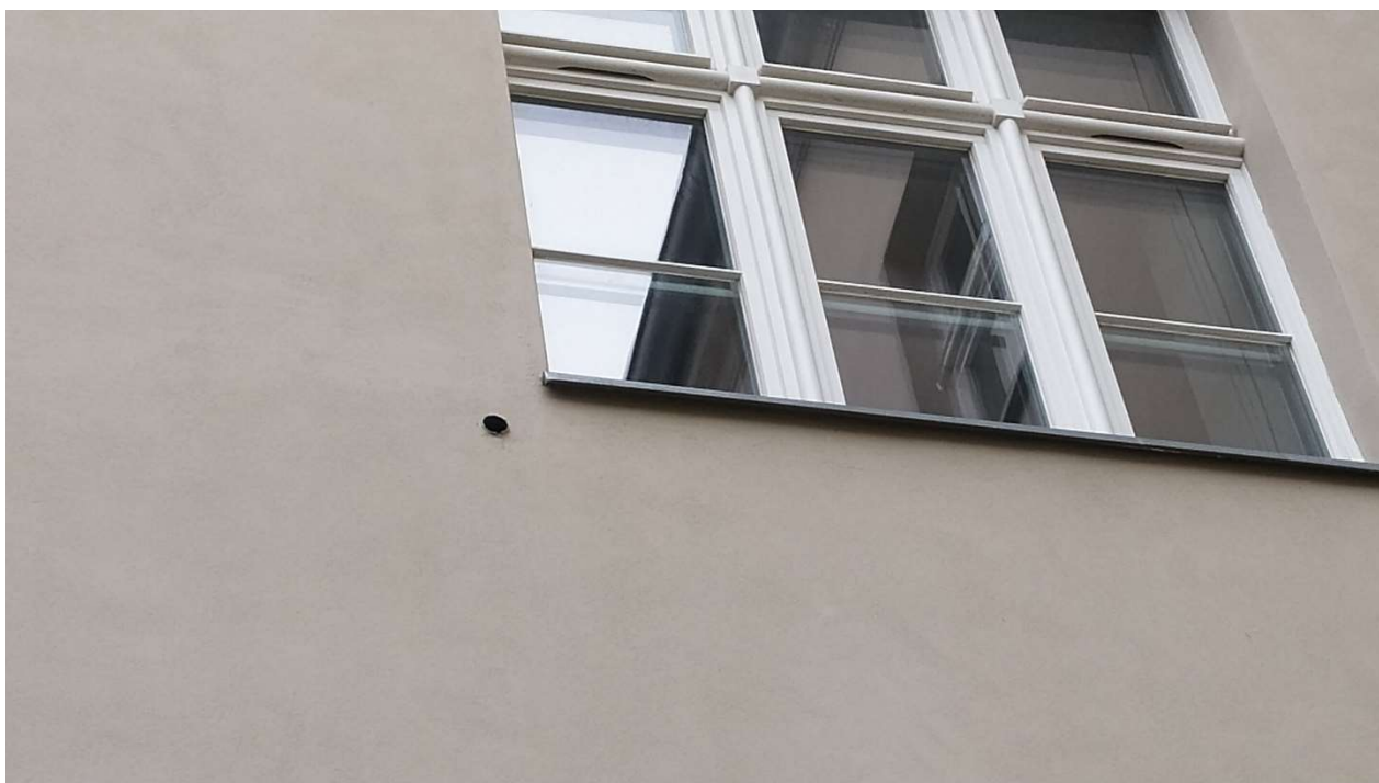
Fot. nr 11: Działanie nr 2 – Elewacja „C” kłóciec wentylacyjny do likwidacji i zamknięcia