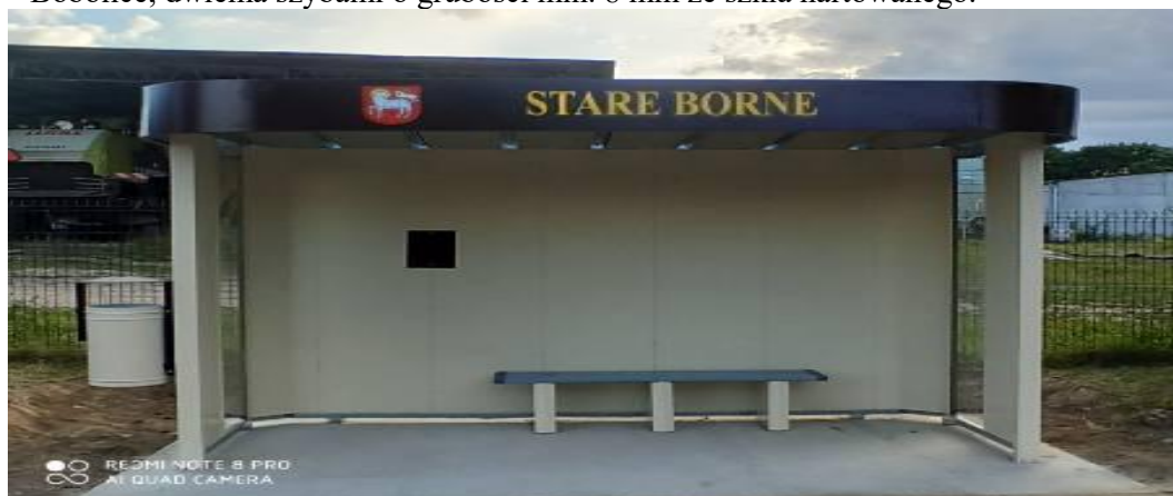
Wiata przystankowa w m. Stare Borne gm. Bobolice

Na odcinku drogi oznaczonym w Załączniku nr 2 jako I-II jest nawierzchnia drogi z płyt betonowych drogowych o szerokości 3,5 m. Jezdnię należy rozebrać, stare płyty drogowe zutylizować lub po obróbce można zastosować jako podbudowę w nowej konstrukcji. Należy poszerzyć konstrukcję drogi, aby finalnie uzyskać 4 m szerokości jezdni i obustronne pobocza po 0,5 m. Należy maksymalnie wykorzystać istniejącą konstrukcję drogi. Na odcinku oznaczonym w Załączniku nr 2 jako II-IV jest nawierzchnia z kamienia polnego. Starą nawierzchnię rozebrać lub wykorzystać jako podbudowę w nowej konstrukcji. Na odcinku II-III jest droga nieutwardzona. Należy wykonać nową konstrukcję i nawierzchnię. Istniejący chodnik należy rozebrać i odtworzyć. Na działce numer 6/7 obręb Trzebień zlokalizowana jest wiata przystankowa, która ma być rozebrana. Na jej miejsce wykonawca wykona podłoże pod nową wiatę przystankową i zamontuje nową wiatę przystankową. Podłoże należy wykonać z betonu B20. Wymiary płyty betonowej długość 3,6 m x szerokość 2,1 m x grubość 0,15 m. Wiata wykonana według wzoru zdjęcia załączonego poniżej. Wiata wykonana z blachy stalowej gr. Min. 1 mm, ocynkowanej i powlekanej kolorowym lakierem. Kolorystyka beżowo-brązowa, z koszem na śmieci, ławeczką, nazwą miejscowości Trzebień i herbem Gminy Bobolice, dwiema szybami o grubości min. 8 mm ze szkła hartowanego.