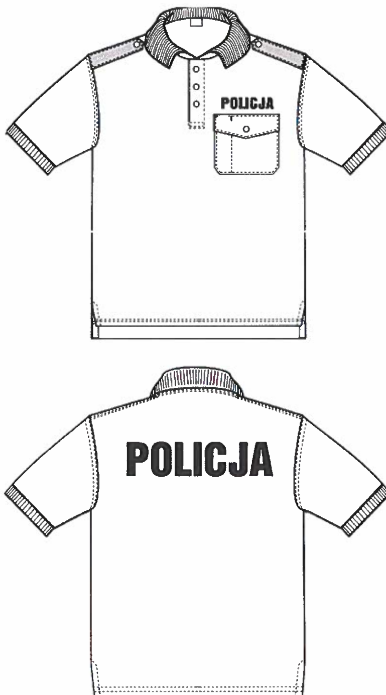
Rys. 1. Rysunek modelowy koszulki polo z krótkim rękawem w kolorze białym – widok z przodu i z tyłu.

Widok ogólny koszulki polo z krótkim rękawem przedstawia rysunek 1.