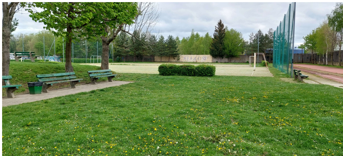
Fot. 2. Widok boisk z terenem zielonym przeznaczonym na „klasę pod chmurką” (strefa „e”).