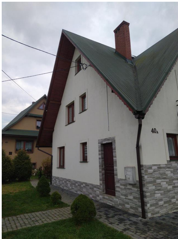
widok od strony N