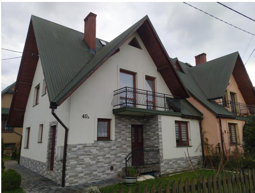
widok od strony W