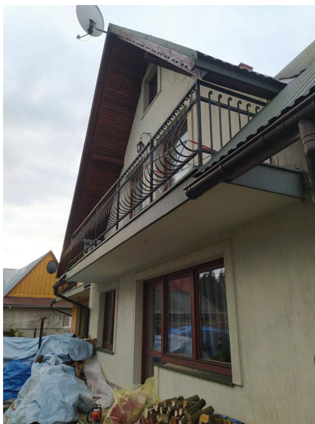
widok od strony E