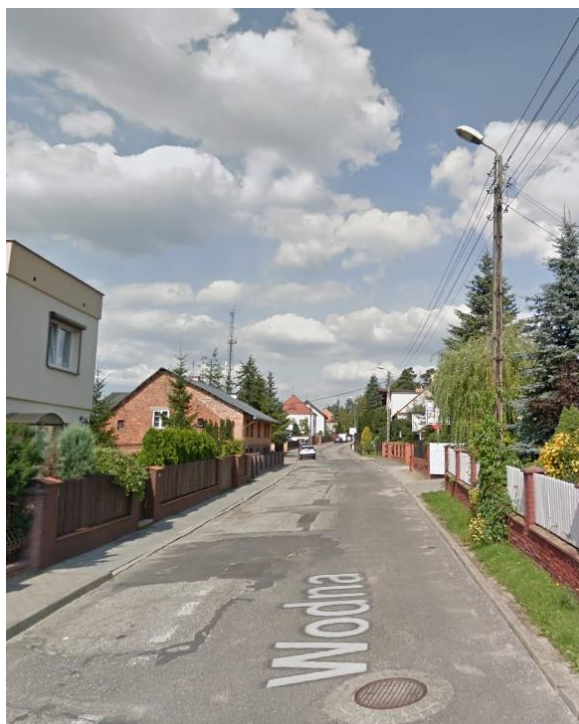
Zdjęcie nr 1 Widok słupa nn 0,4kV z oprawa oświetleniowa

Obecnie wzdłuż ulicy Wodnej i Łąkowej w Murowanej Goślinie prowadzona jest sieć niskiego napięcia 0,4kV należąca do ENEA Operator. Ulica doświetlona jest przez oprawy ENEA Oświetlenie, które znajdują się na słupach przesyłowych sieci nn 0,4kV.