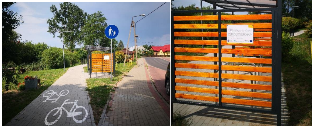
Przykładowe rozwiązanie techniczne poniżej:

Zamawiający informuje, że w wycenie należy uwzględnić dostawę i montaż 1 wiaty typu Bike & Ride równoważne do występujących już na terenie Gminy Dywity tj. na ścieżce pieszo – rowerowej Dywity – Różnowo. Jednocześnie Zamawiający zwraca uwagę, że Wykonawca w wycenie powinien ująć utwardzenie nawierzchni pod wiatą wraz z wykonaniem obrzeży. Zamawiający zamieszcza zdjęcie wiaty na istniejącej ścieżce.