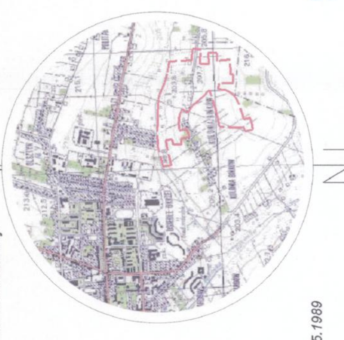
MAPA DO CELÓW PROJEKTOWYCH skala 1:500

Woj. Łódźskie pow. łódzki wschodni Jednostka ewidencyjna: 100101_1, Białychów ul. Wesoła 15 05-110 Białychów Nr zgłoszenia: GK.0541.2394.2016 Oszone, ul. Łódź 2000 Rozm. odbiorca: Komar 60 Pracownia projektowa i inżynierska ul. Wesoła 15, 05-110 Białychów gmina osramieniona - nr 2020 Północny Granice wzniesione zgodnie ze stanem w ewidencji gruntów. Mapa aktualna na dzień 16.09.2016 r. w zakresie opracowania. Urządzenia projektowane sprawozdano w Z.U.D. dnia 07.09.2016 r. Substancje granicznych nie badano. Punkty osnowy geodezyjnej podlegają ochronie - Ustawa z dnia 17.05.1989 - Prawo Geodezyjne i Kartograficzne. Arkusz 2