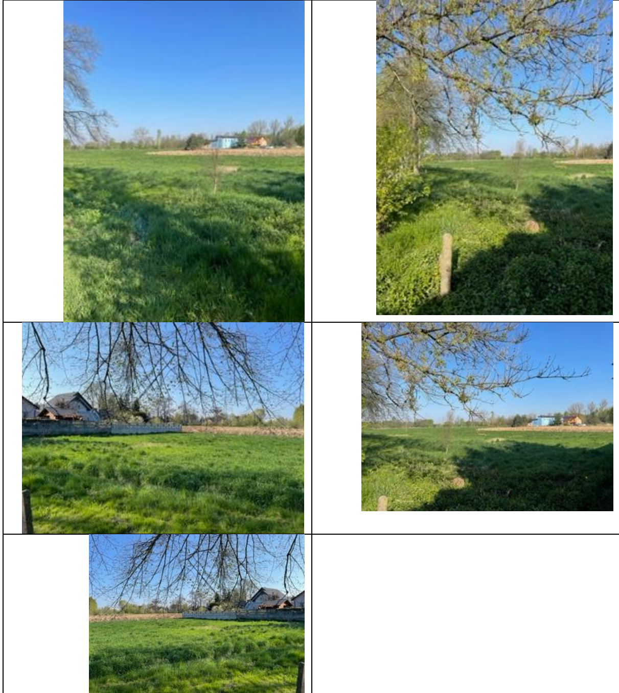
Teren placu zabaw:

36-001 Trzebownisko 976 tel.: +48 177713700, fax. +48 177713719 http://www.trzebownisko.pl poczta@trzebownisko.pl