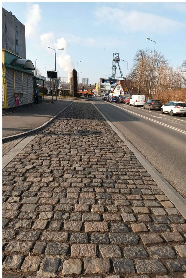
Zatoka nr 1