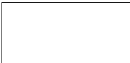
Pieczętka zakładu weterynaryjnego