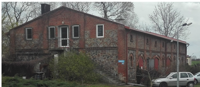
a) Budynek nr 3