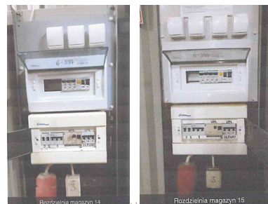
h) Budynek nr 14, nr 15 - rozdzielnia