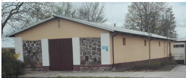
e) Budynek nr 13