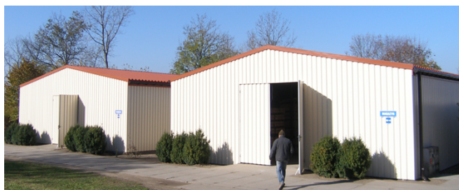
g) Budynek nr 14, nr 15