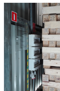
d) Budynek nr 4 – rozdzielnia