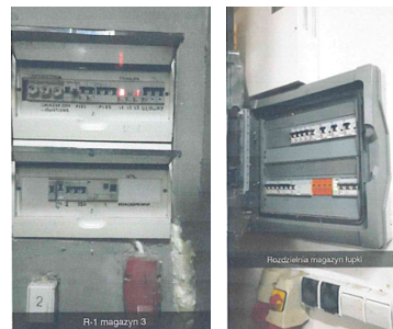
b) Budynek nr 3 – rozdzielnia