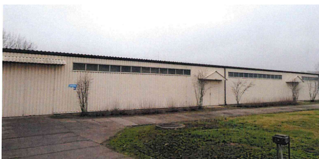
c) Budynek nr 4