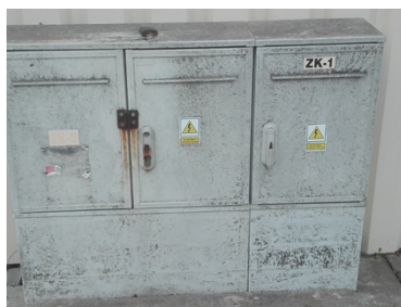
i) Złącze przy bud. 15