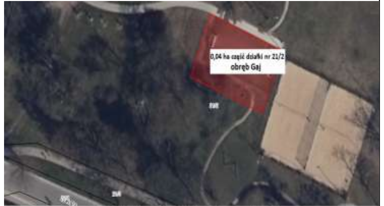
Boisko do piłki nożnej w Parku Skowronim, przy ulicy Weigla

Adres obiektu: ul. Weigla, 50-981 Wrocław Powierzchnia całkowita: około 400 m 2