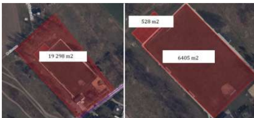
Boisko "Kominiarska" ul. Kominiarska 68, powierzchnia działki 19 298 m 2 , powierzchnia boiska trawiastego 6405 m 2 , powierzchnia boiska EPDM 528 m 2

Adres obiektu: ul. Kominiarska 68, 51-180 Wrocław Powierzchnia całkowita obiektu: około 2 ha, - powierzchnia boiska sportowego o nawierzchni trawy naturalnej 6405 m 2 , - powierzchnia o nawierzchni EPDM 528 m 2 . Dz.12/4: AM – 21-obręb Widawa