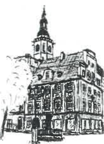
Rynek Wieża ratuszowa