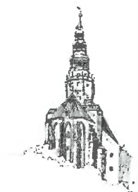
Kościół pw. Św. Stanisława i Św. Wacława Katedra Diecezji Świdnickiej

Ofertę wraz z wymaganymi dokumentami należy umieścić na Platformie pod adresem