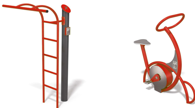
Fot. 4 Drabinka i rowerek (przykładowe zdjęcie)

Funkcja urządzenia: Wpływają na rozwój kończyn górnych i dolnych. Doskonałe na ogólną poprawę wydolności organizmu.