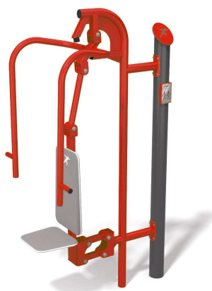
Fot. 2 Wypych/prasa nożna i wyciskanie siedząc (przykładowe zdjęcie)