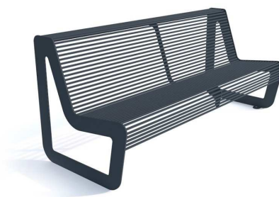
Ławka z oparciem (przykładowe zdjęcie)