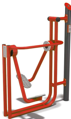
Fot. 1 Orbitrek i biegacz (przykładowe zdjęcie)