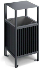
Kosz (przykładowe zdjęcie)