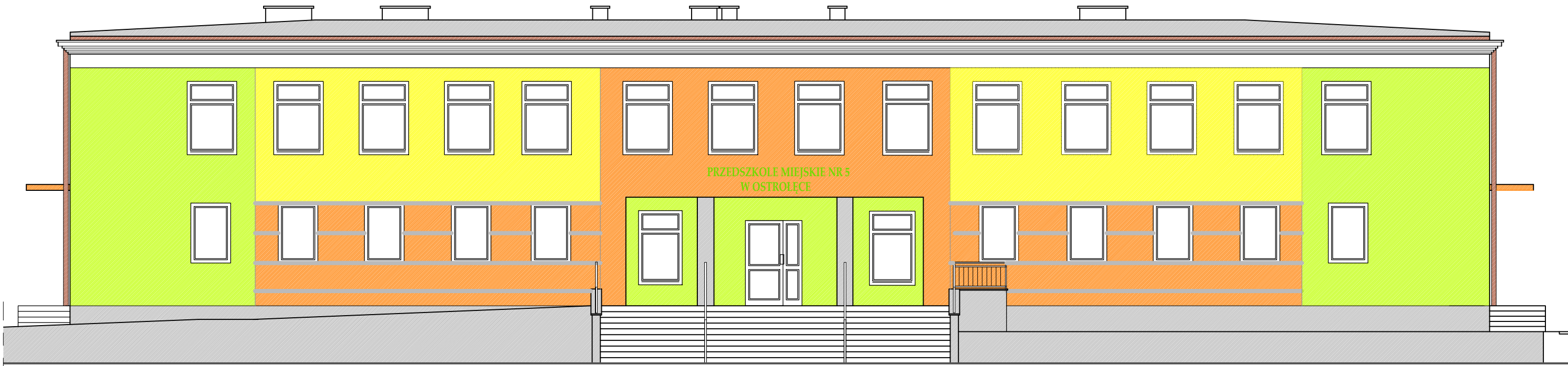
ELEWACJA PÓŁNOCNA - inwentaryzacja