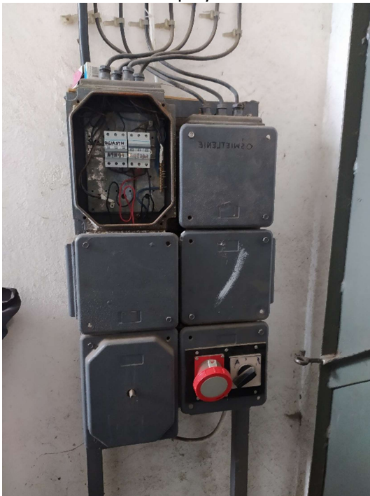
Rozdzielnia przy kotłowni: