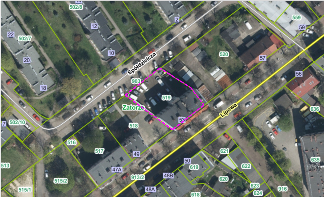
RYS. PT-01. ORIENTACJA