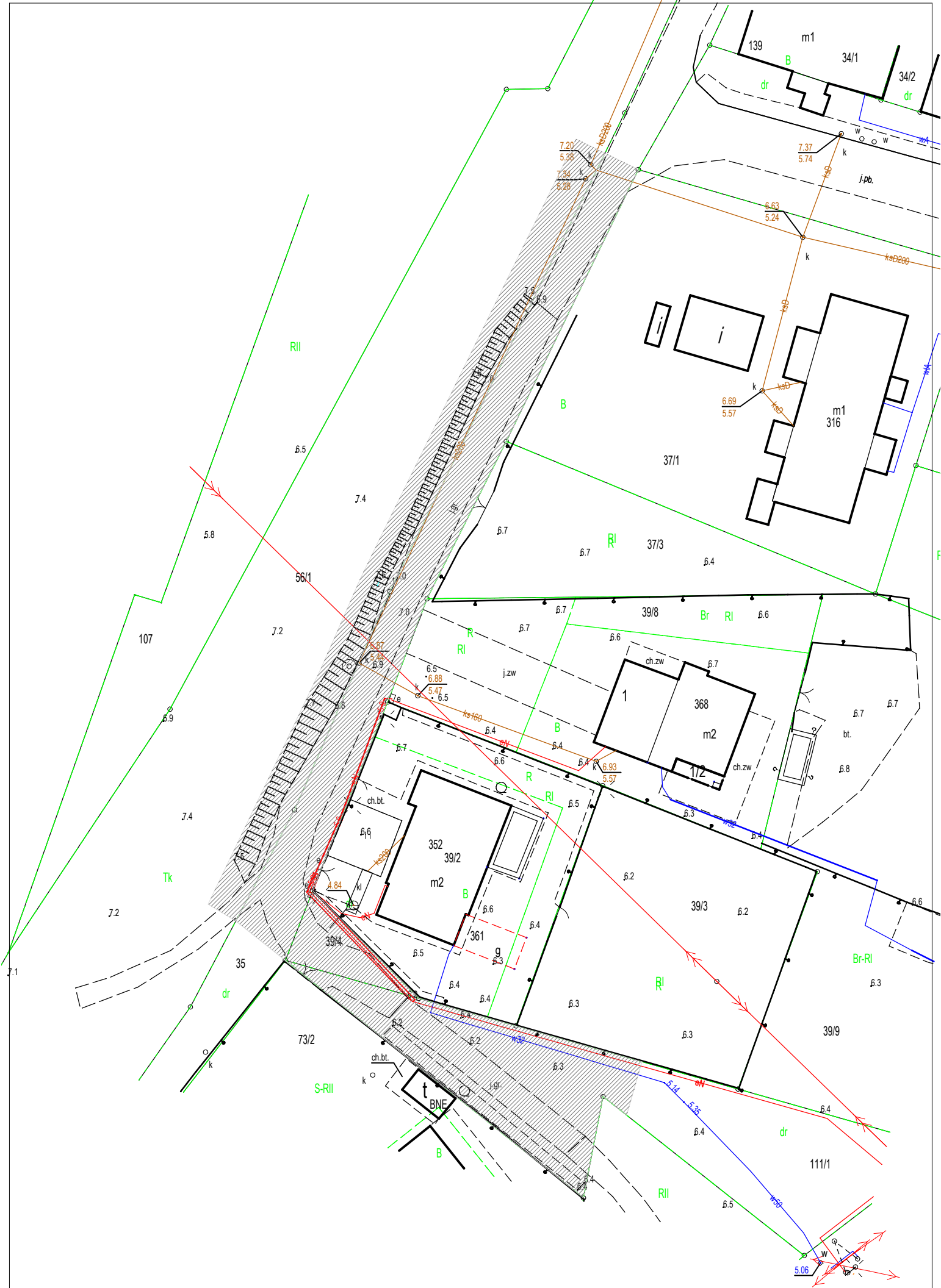
BUDOWA DROGI GMINNEJ WEWNĘTRZNEJ W LISEWIE MALBORSKIM W GMINIE LICHNOWY - PRZEWIDYWANY ZAKRES OPRACOWANIA