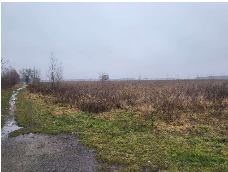
Fotografia 4 Widok w kierunku przyszłego cmentarza i przyszłej Trasy Olimpijskiej