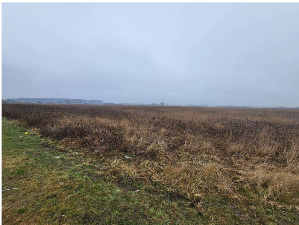
Fotografia 3 Widok na teren przyszłego cmentarza