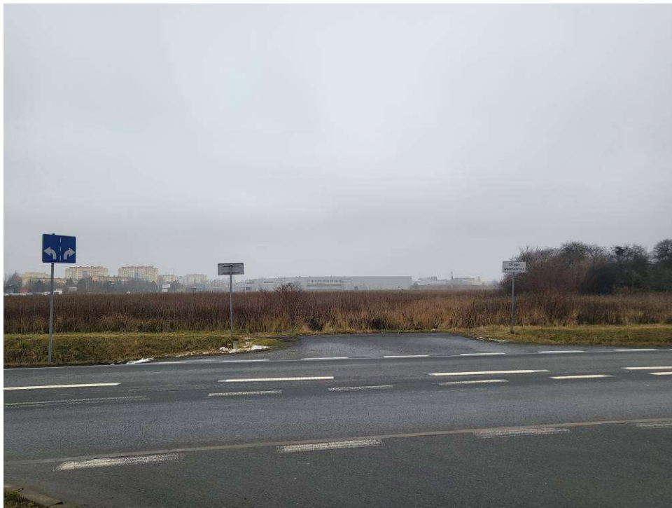
Fotografia 1 Widok na wjazd na cmentarz z łącznika ulic Kielczowski i Bierutowskiej

W południowo-wschodnim narożniku działki 7/29 znajduje się schron mobilizacyjny U-10 z 1914 r. ujęty w Gminnej Ewidencji Zabytków i znajdujący się pod ochroną konserwatorską.