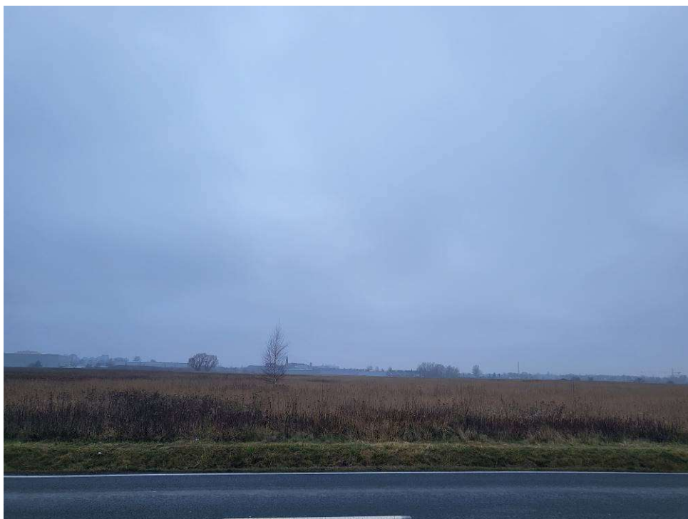
Fotografia 5 Widok na teren przyszłego cmentarza z drogi łączącej ul. Kielczowską i ul. Bierutowską