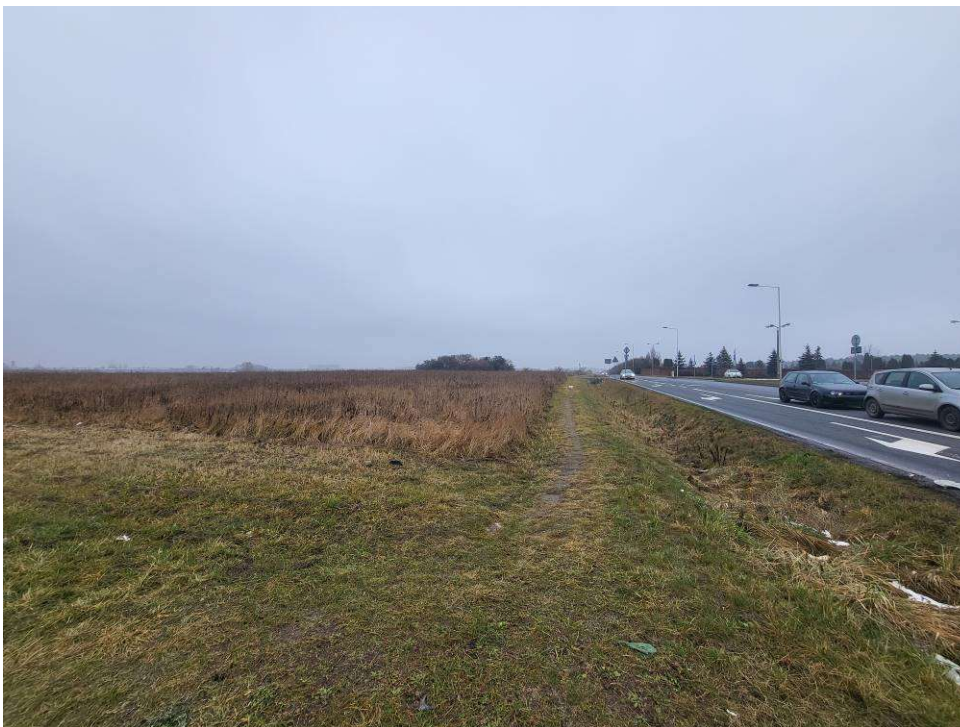
Fotografia 2 Widok w kierunku ul. Bierutowskiej