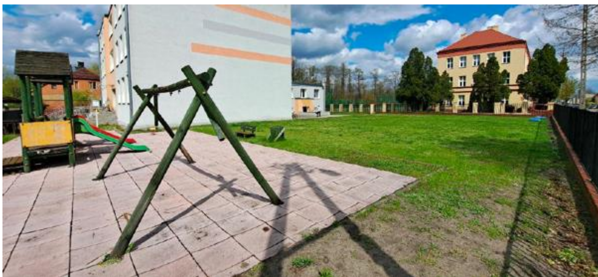
Fotografia 2 Widok terenu inwestycji

Na terenie objętym inwestycją zaprezentowano na fotografii poniżej. (fot. 2)