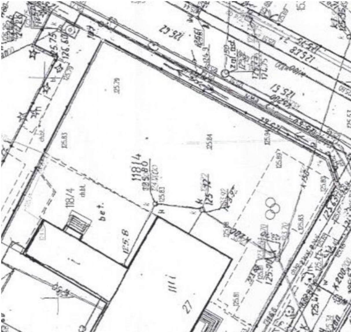
Fotografia 3 Lokalizacja sieci wokół terenu inwestycji

W pobliżu obiektu znajduje się sieć energetyczna, sieć wodociągowa i kanalizacyjna.