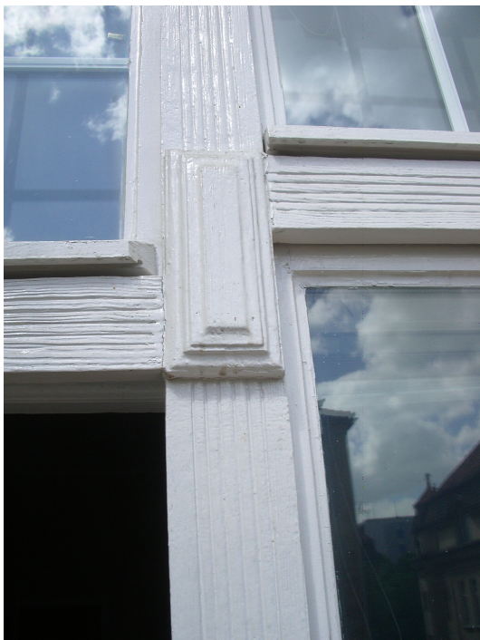
PRZEKRÓJ POZIOMY B-B 1:2