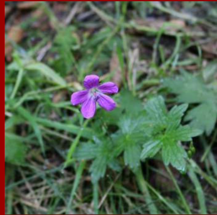
Bodiszek błotny Geranium palustre