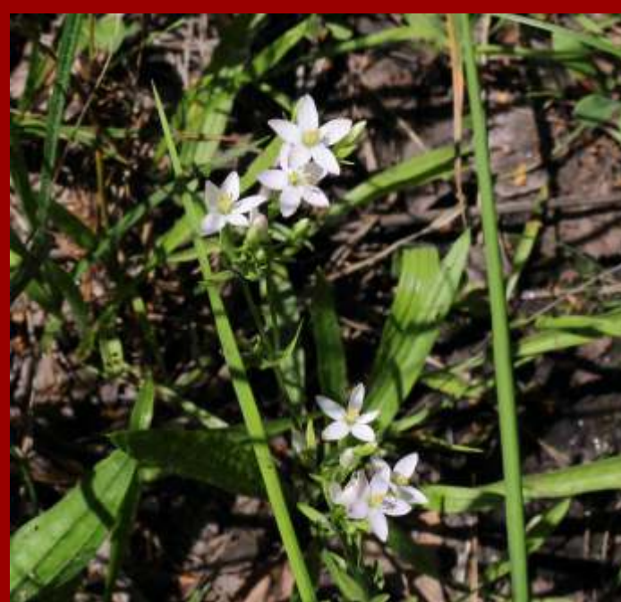
Centuria pospolita (forma białokwiatowa) Centaurium erythraea