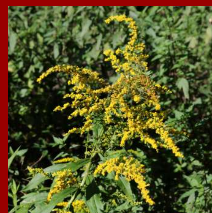
Nawłoc kanadyjska Solidago canadensis