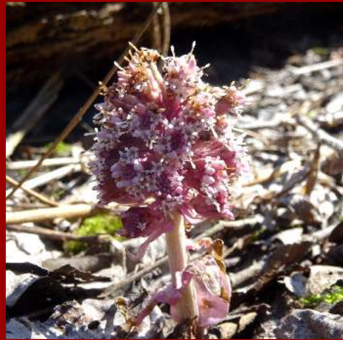
Lepięznik różowy Petasites hybridus