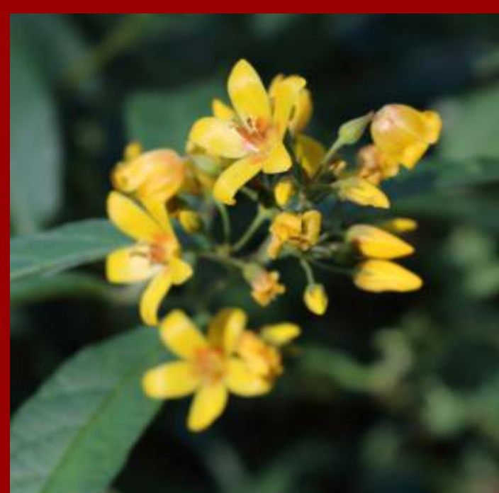
Tojeść pospolita Lysimachia vulgaris