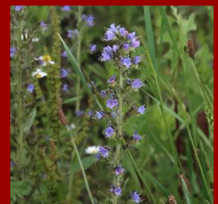
Żmijowiec zwyczajny Echium vulgare