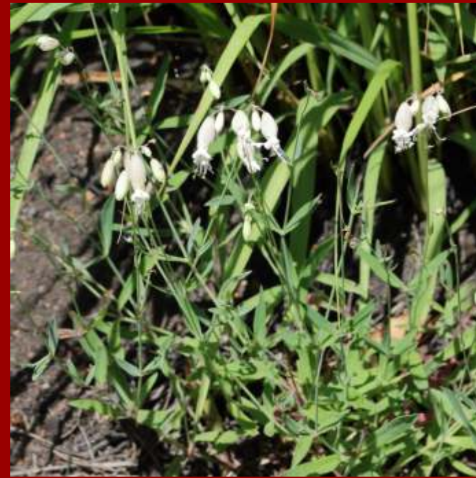
Lepnica rozdęta Silene vulgaris