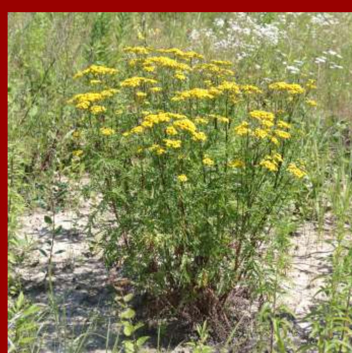
Starzec Jakubek Senecio jacobaea