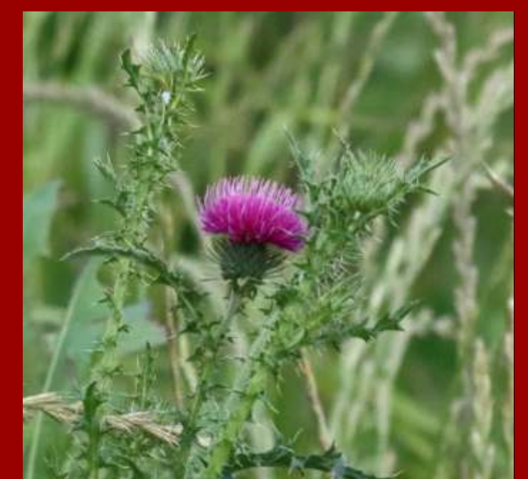
Oset nastroszony Carduus acanthoides