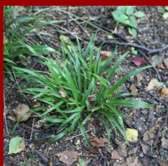
Kosmatka owłosiona Luzula pilosa