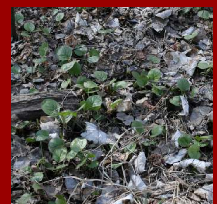
Gruszczyca okrągłolistna Pyrola rotundifolia