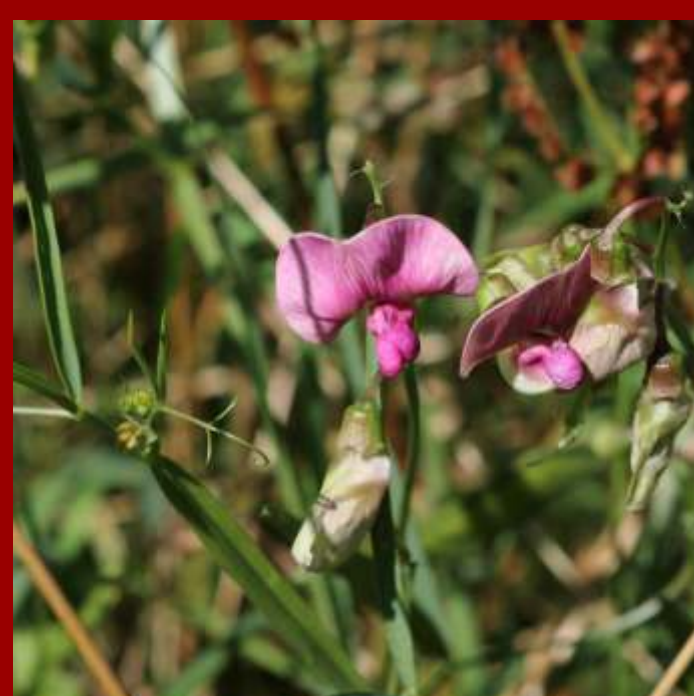
Groszek leśny Lathyrus sylvestris