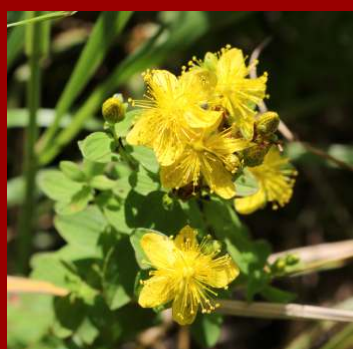
Dziurawiec zwyczajny Hypericum perforatum