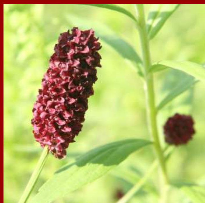
Krwieściąg lekarski Sanguisorba officinalis