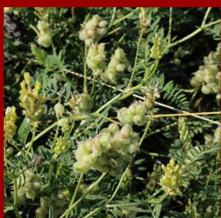
Traganek pęcherzykowaty Astragalus cicer