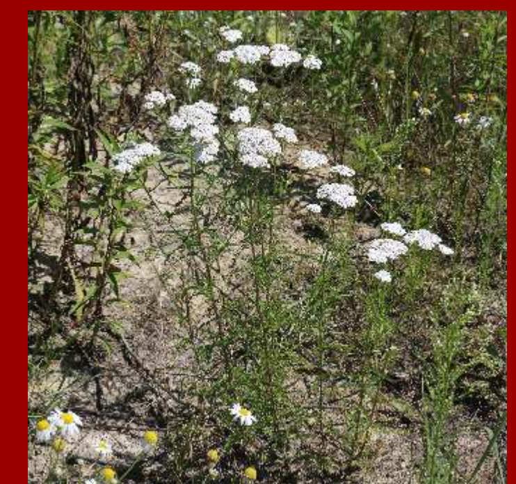
Krwawnik pospolity Achillea millefolium