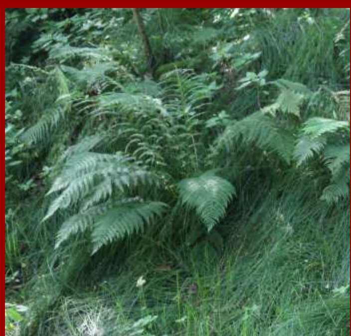
Wietlica samicza Athyrium filix-femina