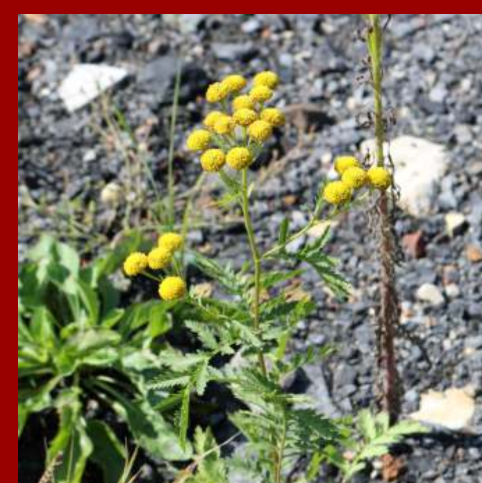
Wrotycz pospolity Tanacetum vulgare