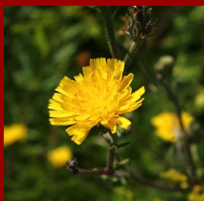
Goryczel jastrzębcowaty Picris hieracioides