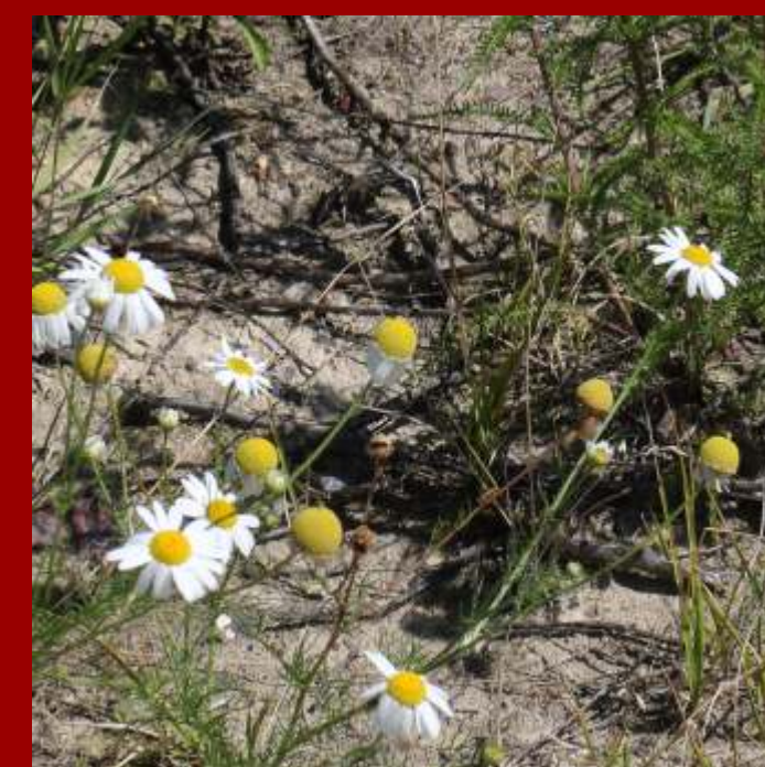
Maruna nadmorska bezwonna Matricaria inodora