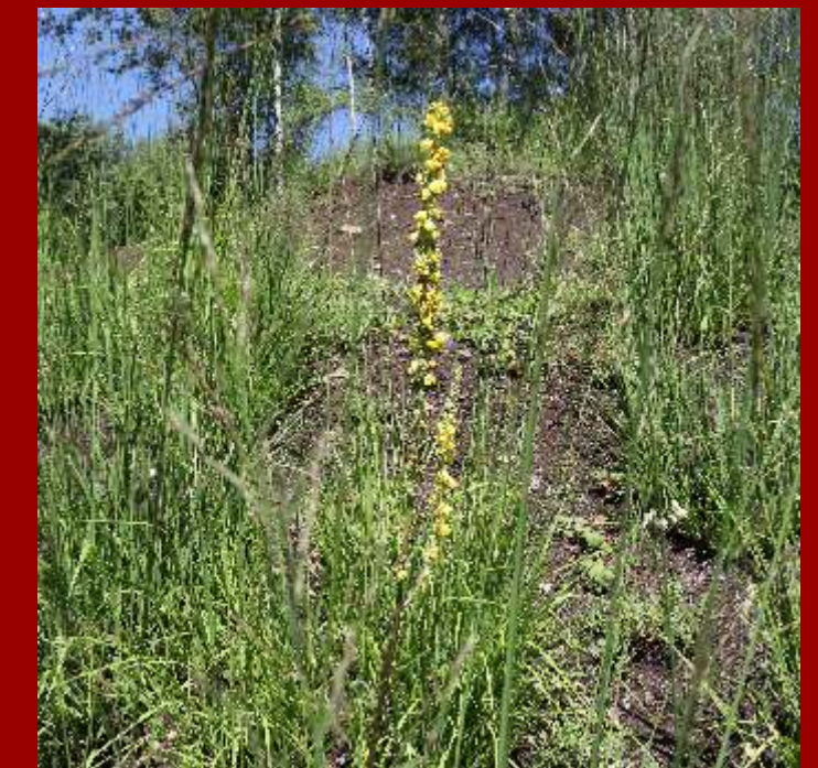
Dziewanna pospolita Verbascum nigrum