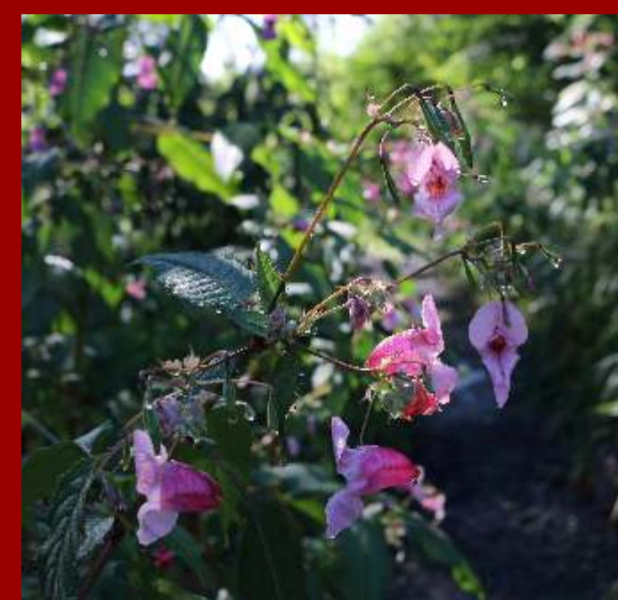
Niecierpek gruczołowaty Impatiens glandulifera