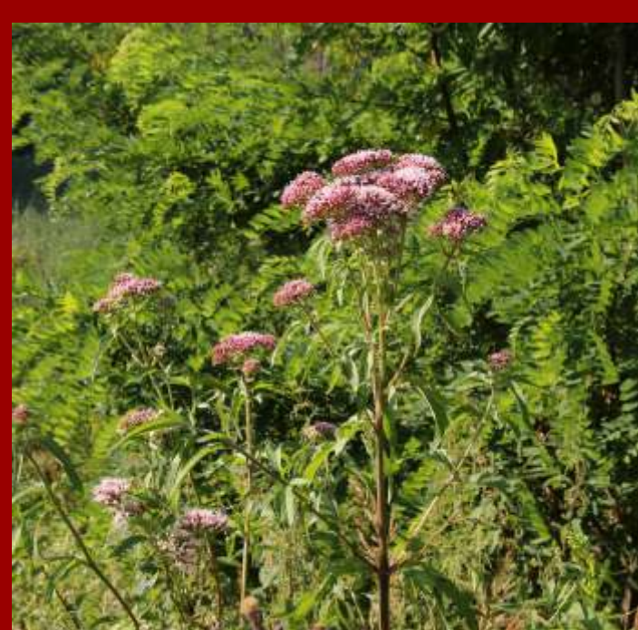
Sadziec konopiasty Eupatorium cannabinum