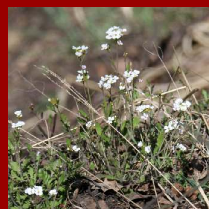
Rzeżusznik (gęsiówka) piaskowy Cardaminopsis arenosa