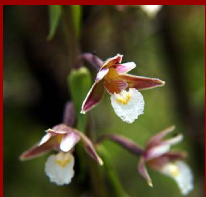
Kruszczyk błotny Epipactis palustris