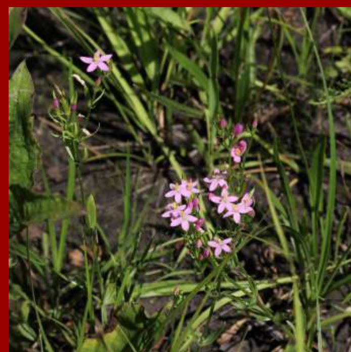
Centuria pospolita (forma różowokwiatowa) Centaurium erythraea