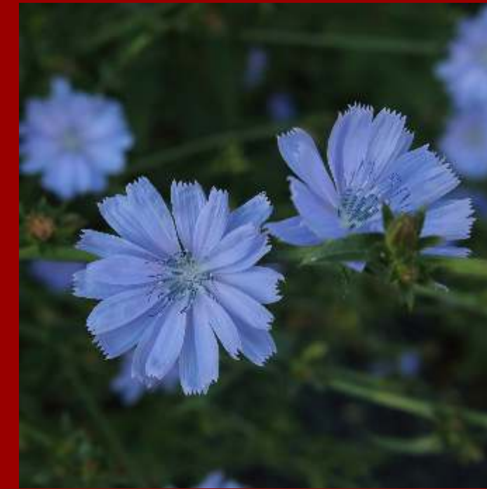
Cykoria podróżnik Cichorium intybus