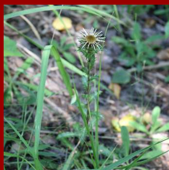
Dziewięcśl pospolity Carlina vulgaris