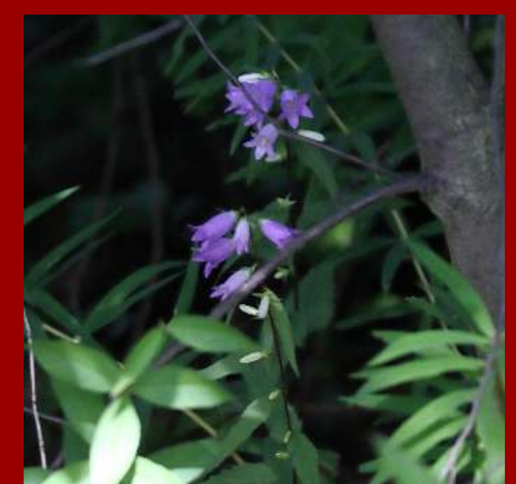
Dzwonek pokrzywolistny Campanula trachelium