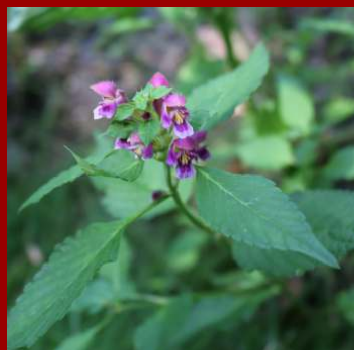
Poziewnik miękkowłosy Galeopsis pubescens