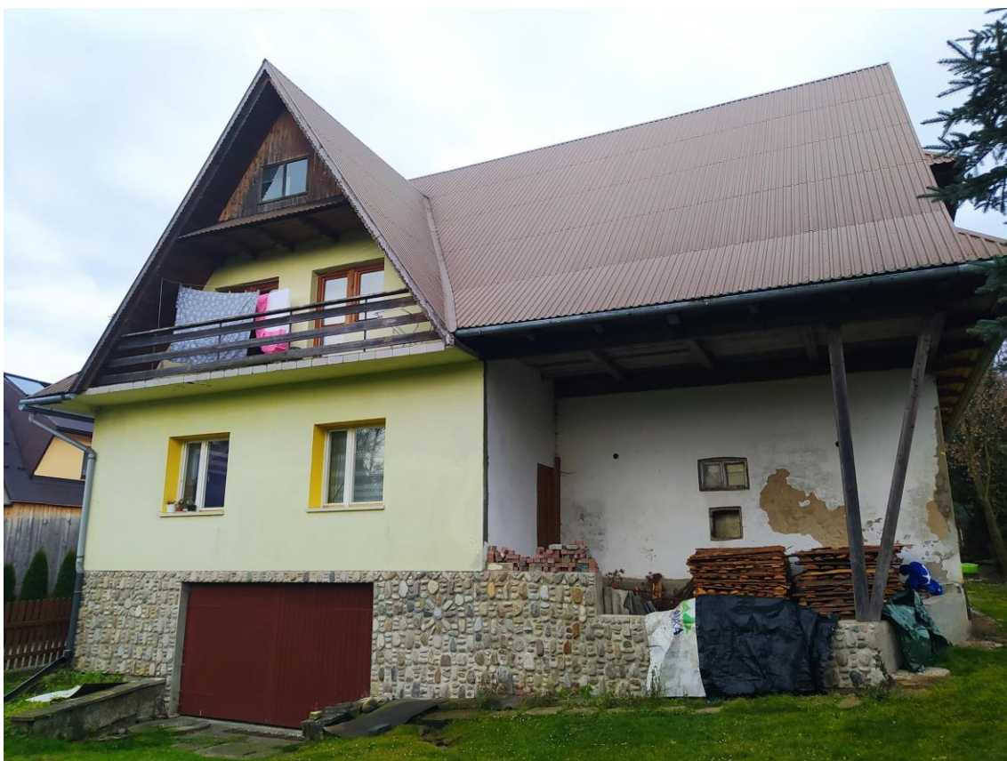
widok od strony W