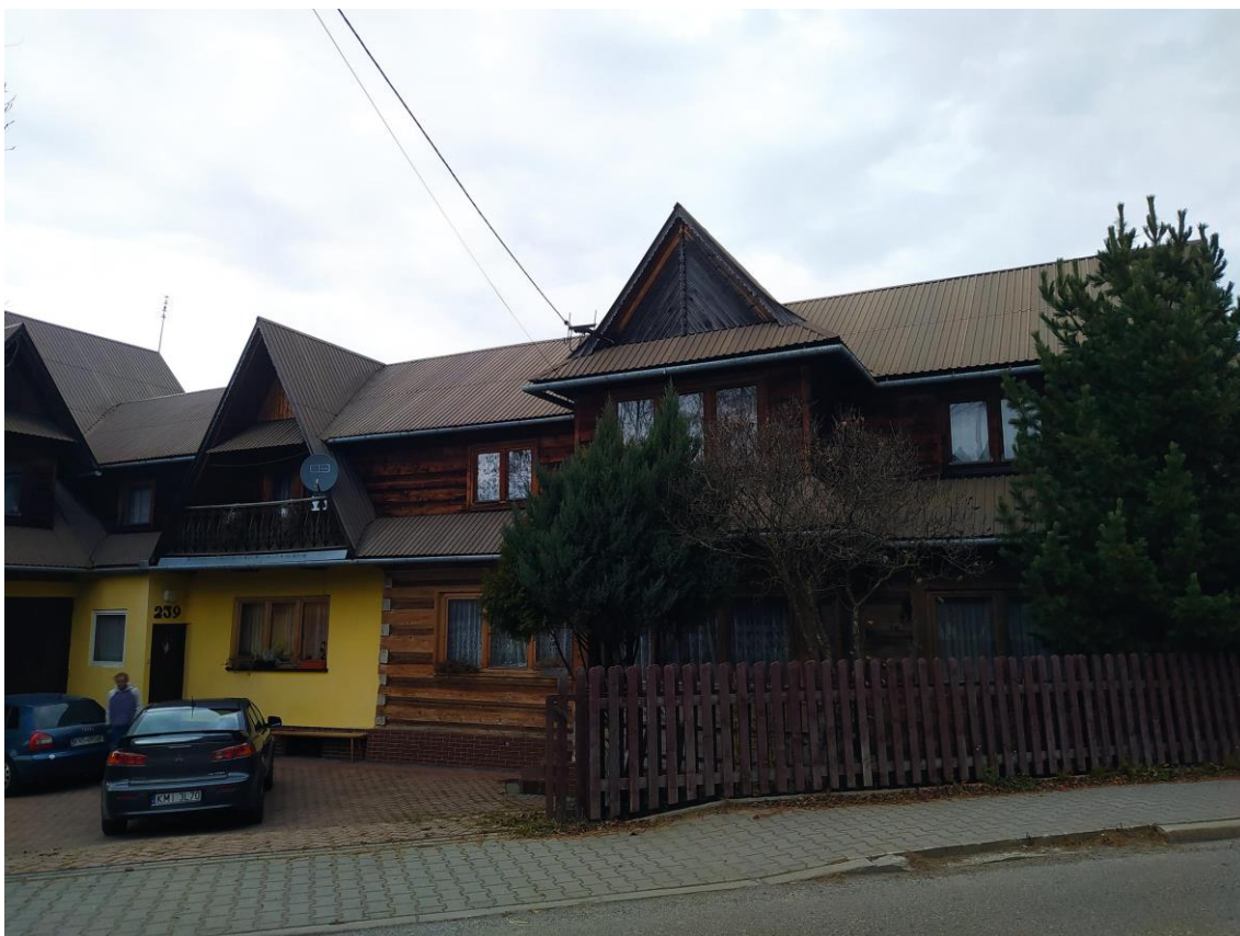
widok od strony S