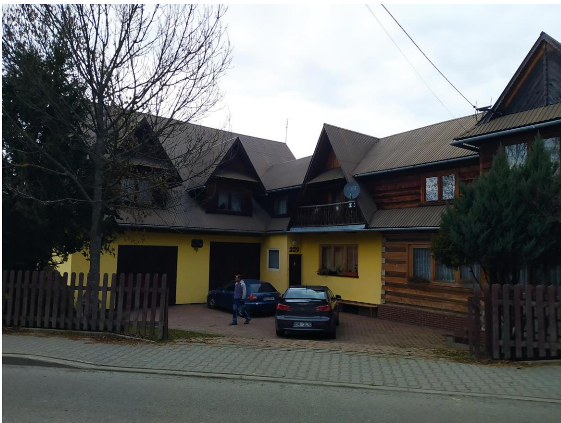
widok od strony E