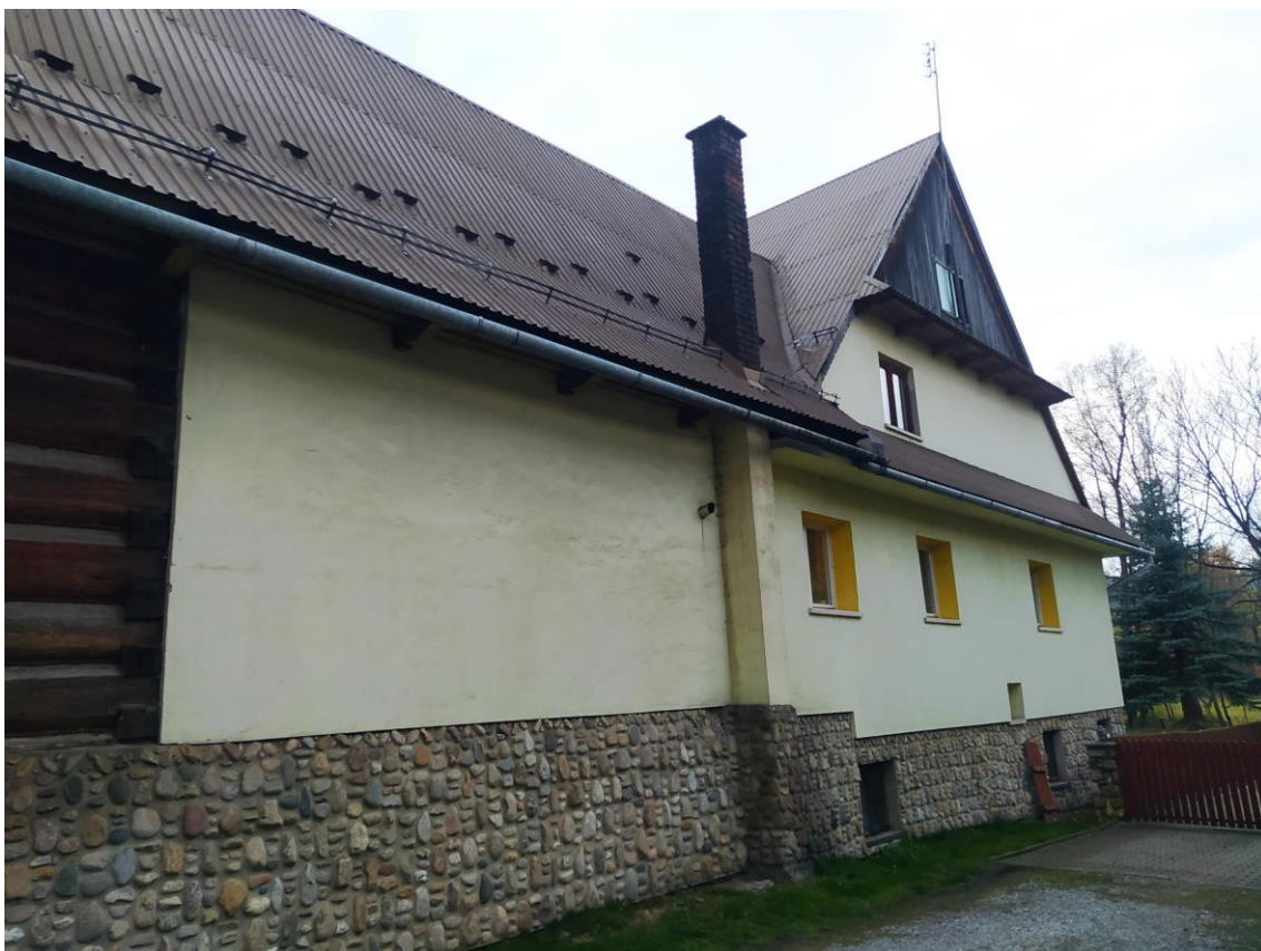
widok od strony N