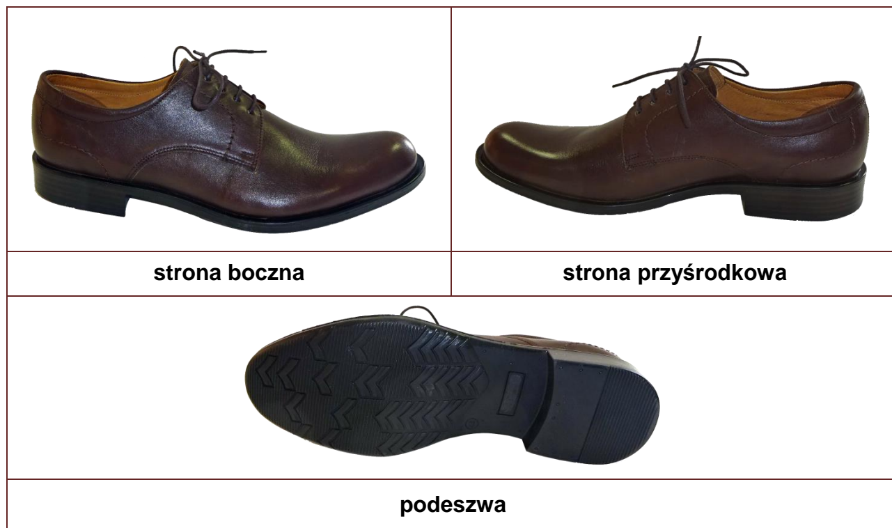
Fot.1 Wzór półbutów męskich do munduru wyjściowego