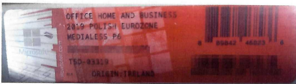
Rys. 2 przykładowy kod zabezpieczony przez producenta systemu Microsoft Windows Office Home&Business z wymazanym, znajdującym się w prawym dolnym rogu numerem seryjnym produktu. Kod licencyjny znajduje się w środku szczelnie zapakowanego i zafoliowanego pudełka (Rys. 3)