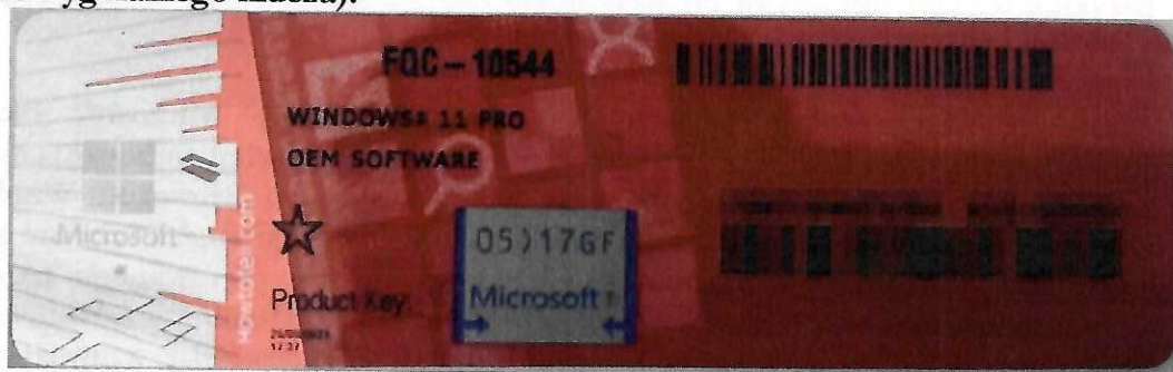
Rys. 1 przykładowy kod zabezpieczony przez producenta systemu Microsoft Windows 11 (takie same naklejki mają Windows 10) z wymazanym, znajdującym się przed i za szarą naklejką kodem licencyjnym

Poniższe zdjęcie obrazuje obecnie stosowane zabezpieczenia producenta firmy Microsoft (klucz systemu jest zabezpieczony naklejką hologramową przez producenta. Po jej zdrapaniu uzyskujemy dostęp do oryginalnego klucza):