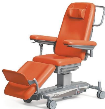
(Zdjęcie poglądowe oferowanego fotela)

Odpowiedź: Zamawiający nie wyraża zgody.