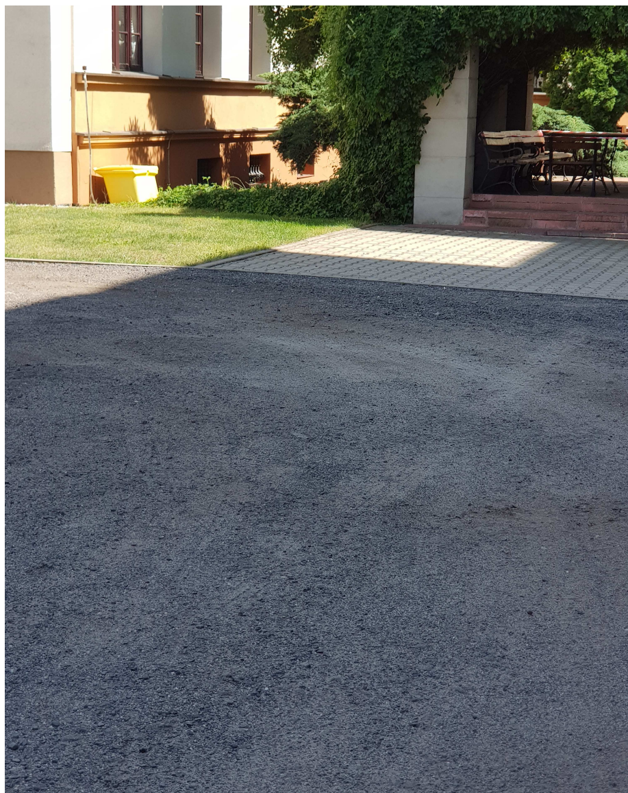
Fot. 1 Istniejąca nawierzchnia placu manewrowego