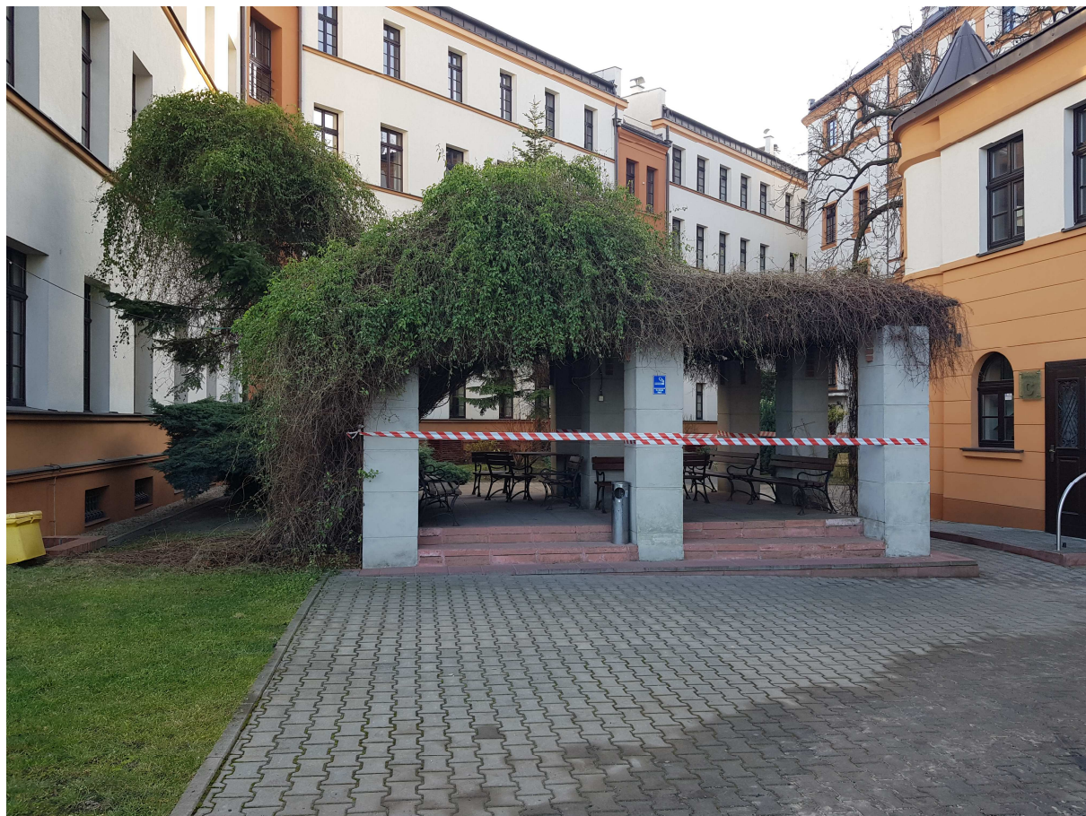
Fot. 4 Pergola