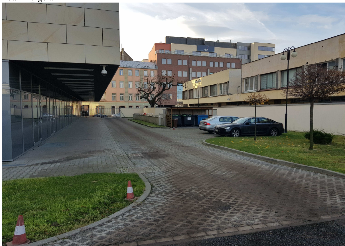
Fot. 5 Droga dojazdowa