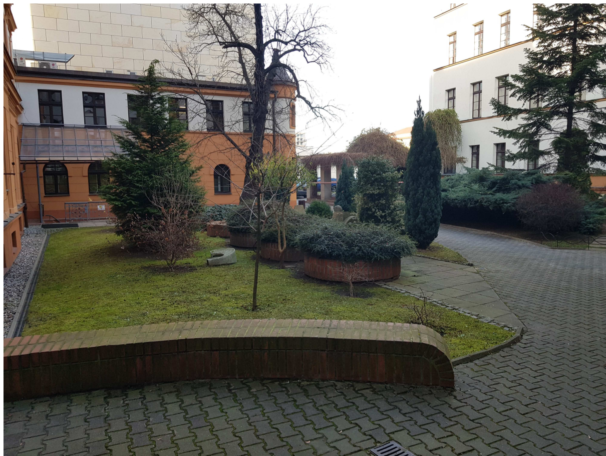
Fot. 3 Stary dziedziniec