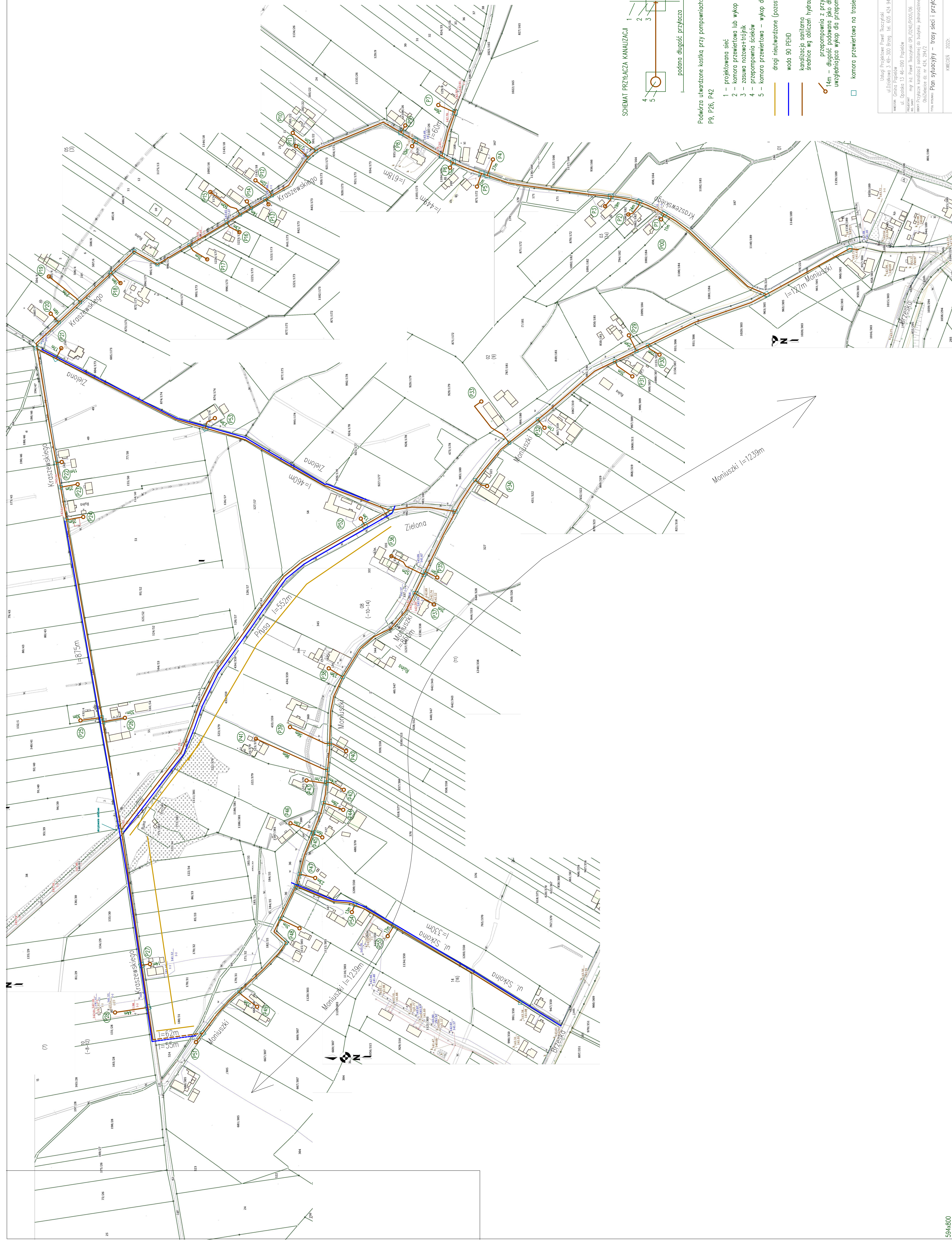
SCHEMAT PRZYŁĄCZA KANALIZACJI