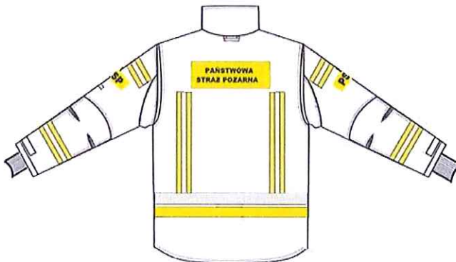
Przykładowy widok kurtki