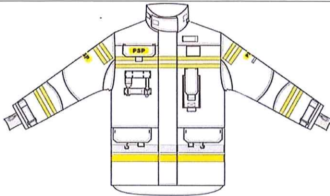
Przykładowy widok kurtki