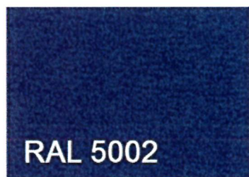
KOLOR SŁUPKÓW, RAMEK I TABLICZEK