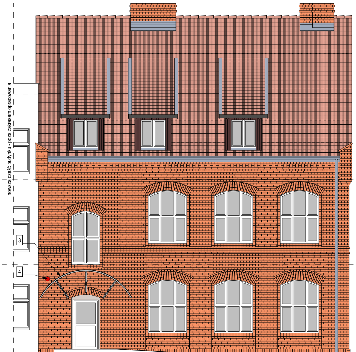
E-01 Elewacja południowa 1:100