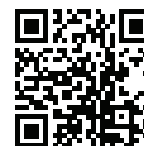
Parametry techniczne OS-11 LED