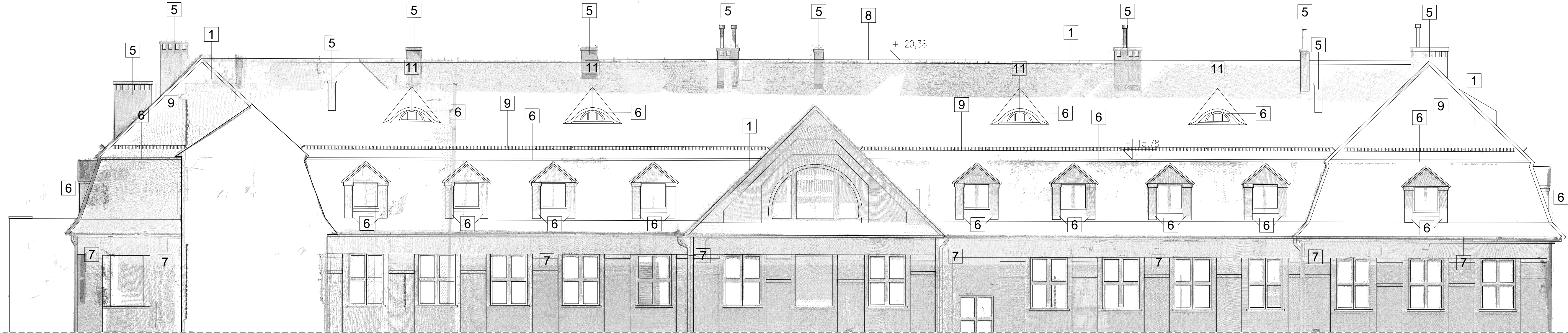
Przekrój B-B i elewacja zachodnia 1:100

LEGENDA Zakres prac związanych z remontem dachu