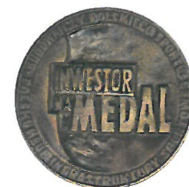
Wyróżnienie w kat. „Inwestor na Medal” w konkursie „Budowniczy Polskiego Sportu”