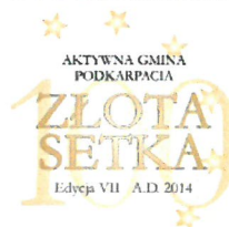
Skuteczny beneficjent środków unijnych