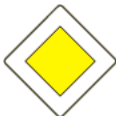
D-1 szt. 4