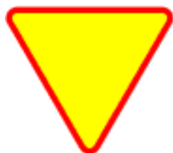
A-7 szt. 2