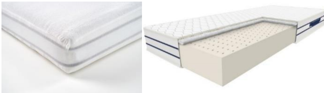
rys. 1 - Ochraniacz z wodoodpornej i paroprzepuszczalnej frotty z bokami z bawełnianej siatki

Materac z wkładem lateksowym z pokrowcem i nakładką zabezpieczającą. Wkład materaca wykonany z bloku lateksowego o grubości 16 cm o właściwościach antibakteryjnych i przeciwgrzybiczych z 7 strefami twardości i dużej elastyczności uzyskanymi dzięki licznym otworom, umożliwiającym swobodną cyrkulację powietrza i zapewniającym konieczną wentylację. Materac posiada stronę zimową wyłożoną warstwą wełny owczej oraz stronę letnią wyłożoną warstwą bawełny.