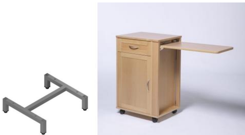
rys. 1 - Spawany stelaż szafki

Szafka przyłóżkowa posadowiona na stelażu metalowym. Model wyposażony o rozkładany blat boczny (lewy lub prawy do ustalenia z Zamawiającym w zależności od układu sali pacjenta). Wygodny system wysuwania blatu sprawi, że korzystanie z dodatkowej funkcji szafki – jaką jest umożliwienie osobie leżącej na łóżku spożywanie posiłków, stanie się proste i komfortowe w pomieszczeniach o ograniczonej powierzchni.