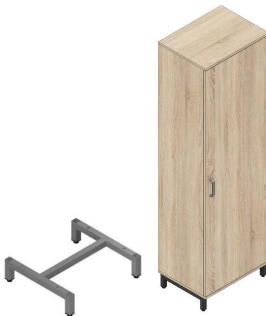
rys. 1 - Spawany stelaż szafki

Szafka ubraniowa z drzwiami skrzydłowymi posadowiona na stelażu metalowym. Korpus i front szafy wykonane z płyty wiórowej trójwarstwowej w klasie higieniczności E1 obustronnie melaminowanej o grubości 18 mm oklejonej w widocznych miejscach obrzeżem PVC o grubości 2 i 1 mm w kolorze płyty. Krawędzie obrzeża zaokrąglone. Korpus szafy połączony za pomocą złączy mimośrodowych umożliwiających wymianę poszczególnych elementów w przypadku ich uszkodzenia. Nie dopuszcza się stosowania korpusu łączonego za pomocą kleju. Ściana tylna wpuszczana w nafrezowania w ścianach bocznych oraz wieńcach korpusu, wykonana z płyty wiórowej trójwarstwowej w klasie higieniczności E1 obustronnie melaminowanej o grubości 18 mm. Ściana tylna montowana do korpusu szafy zarówno ścianek bocznych jak i wieńców za pomocą złączy mimośrodowych. Kolorystyka ściany tylnej zgodna z kolorystyką korpusu szafy. Wieniec górny oraz dolny nakładane na ściany szafki przystające względem ich przednich krawędzi, przednie krawędzie wieńców widoczne przy zamkniętych drzwiach.