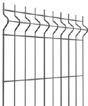
Rysunek 1 Wzór panelu ogrodzeniowego

Panel ogrodzeniowy 2500x1500 z prętów o średnicy 4 mm i stali ocynkowanej, pokryty powłoką poliestrową w kolorze RAL 7016.